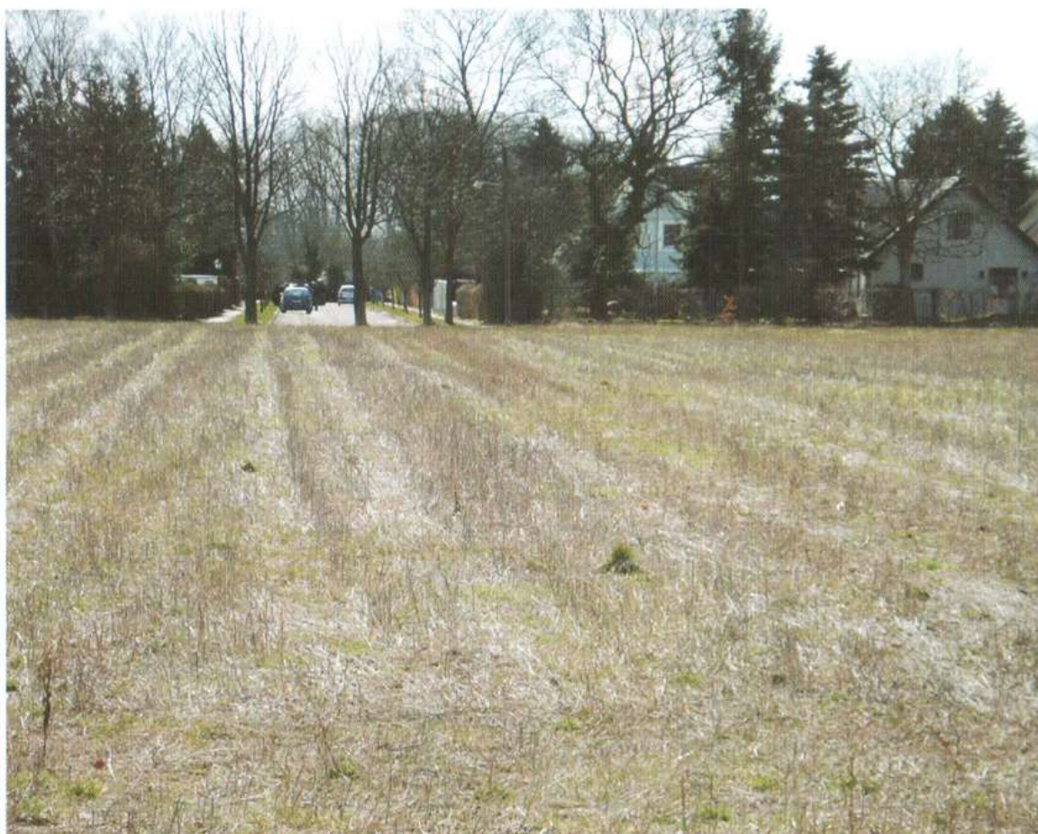
Den gamle fodboldbane ved Kastanie Allé. (Foto: Kurt Bach, april 2006)