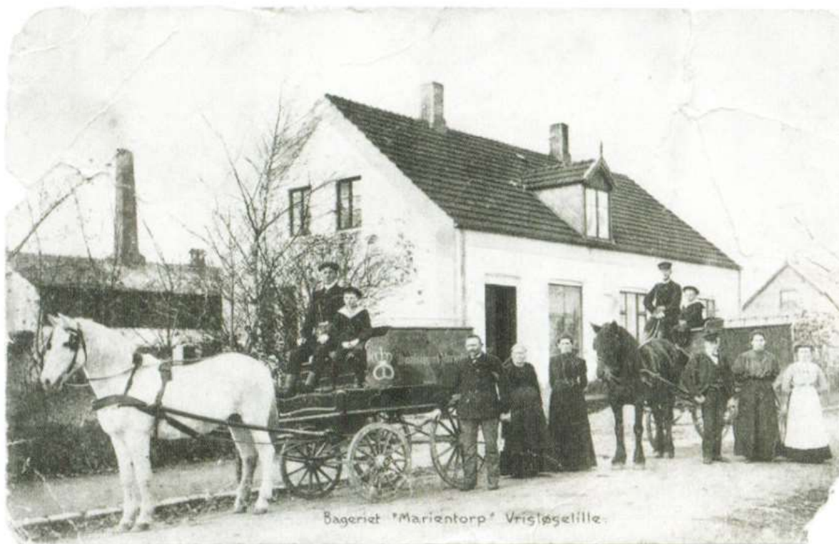
Bageriet "Marientorp", Kastanie Allé.