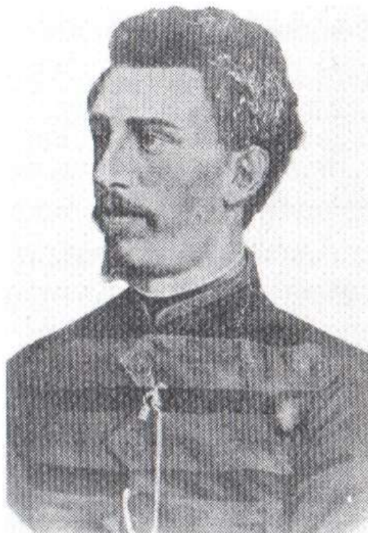
Louis Pio i fangedragt

Louis Pio har også en anden tilknytning til egnen. Han var nemlig født i Roskilde. Sammen med Povl Geleff holdt han politisk møde i Roskilde i 1872, men da diskussionen dengang ikke kun blev ført med verbale metoder, måtte han og Geleff flygte ud ad et vindue i hotel „Prindsen“ af frygt for at blive korporligt afstraffet 23 . Det danske Socialdemokrati, dengang en afdeling af Internationale, havde kig på Hedehusene som et agitationsområde, fordi der her fandtes en del grusgrave og teglværker med ufaglært arbejdskraft. Ifølge en annonce i „Socialisten“ den 19. april 1872 har Povl Geleff efter opfordring holdt foredrag søndag den 21. april klokken fire om eftermiddagen i Taastrup Nykro. Medlemmer af „Internationale“ havde fri adgang. Andre måtte slippe 8 skilling for at komme ind 24 .