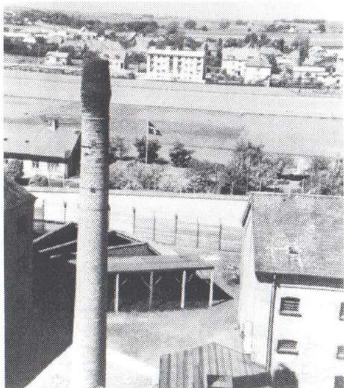
Udsigten fra et vindue i fængslet, set mod vest. I baggrunden ses husene på Linde Alle, som var nogle af de første etageejendomme i Herstederne.