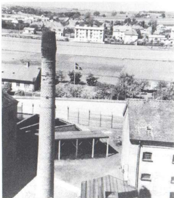
Udsigten fra et vindue i fængslet, set mod vest. I baggrunden ses husene på Linde Alle, som var nogle af de første etageejendomme i Herstederne.