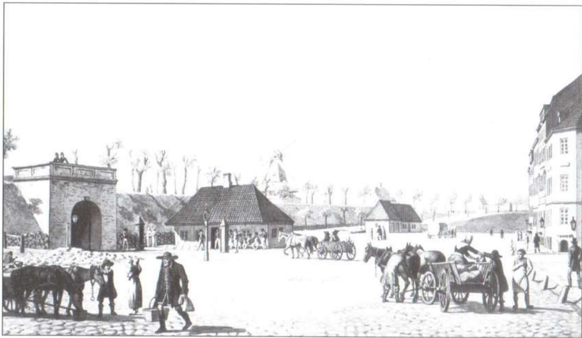
Vesterport set fra Halmtorvet. På volden Store Kongens Mølle. Til venstre for møllen ses vagtbygningen og til højre sprøjtehuset. Yderst til højre: Hjørnet af Frederiksgade, Absalons Gård. (Efter akvarel af C.V. Eckersberg, 1809. Bymuseet i København).