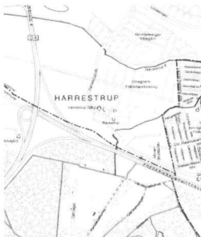
Harrestrup fik sine trafiklinier skåret over, da Frederikssundmotorvejen blev anlagt. Kort: Albertslund Kommune, 1990.

Reguleringen fandt som planlagt sted den 1.april 1974 og dermed var Ballerup kommune pludselig blevet større. Beboerne i Harrestrup havde, og har stadig, et lidt forvirret forhold til deres nye bopælskommune. De føler sig knyttet til Herstedøster, og kommer stadig til arrangementer i byens forsamlingshus, menighedsråd og idrætsklub. Det skyldes til dels, at byentidligere hørte under Hersted-