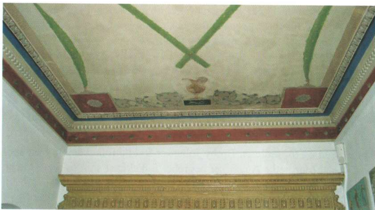
Indgangen til Toftekærgård, Egelundsvej 7.

udskåret med inspiration fra de græske templer. Vi kender ikke navnet på den malersvend, som har lavet disse dekorationer. Måske har dekorationskunstnere gået fra hus til hus og tilbudt at give beboerne noget godt at se på i det daglige. Fordi ejeren af Toftekærgård i sin tid sagde ja til udsmykning af loftet i indgangen, kan vi i dag have glæde af at se op i loftet, mens vi hænger tøjet på knagerne.