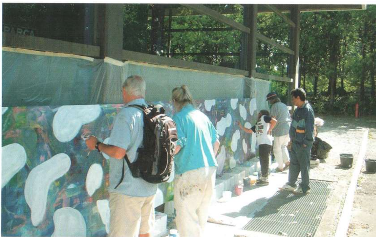
Værsgo' at male! I anledning af Albertslund Festival i september 2005 blev alle opfordret til at være med til at male et fællesbillede.

”Jeg ønsker, at flere og flere oplever glæden ved at tegne og male. Det er en kreativ beskæftigelse. Man slapper af, mens man arbejder med det. Man øves i en kreativ proces, hvor man hele tiden skal tage små beslutninger og forbedre og udvikle det, man i forvejen kan. Nogle spiller på et instrument og får samme oplevelse gennem musikken. Man trives i processen, og man har en rar fornemmelse, når man er færdig. Det er helse for sindet. Alt for mange timer bruges til at modtage, og det kan være passivt, f.eks. når vi lytter og ser radio/tv og læser aviser.”