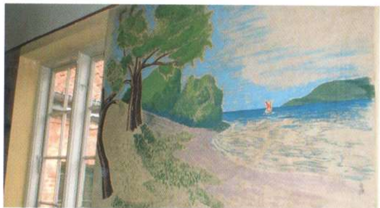
Torpp Larssons vægbilleder kan få eleverne på Vridsløselille Skole til at glæde sig over Danmarks historie og natur. (Foto: Jørgen Nielsen, 2005)