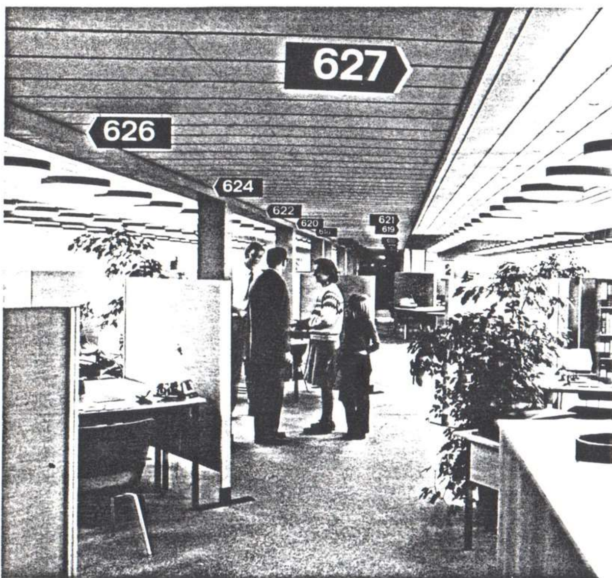
Interiør fra skatteforvaltningen ved ibrugtagningen 1971.

Også på andre områder mærkede borgerne brugervenlighed. Både mødesal og kantine blev flittigt brugt til foreningsmøder, kulturaftener, og meget andet, indtil der kom rigeligt med mødelokaler andre steder. Mødesalen, som havde et mindre operatørrum, var kommunens biograf, før Albertslundhuset blev bygget med de to biografer. Og så var der i forhallen hyggelige ventepladser med udsigt over søen, legehjørne til børnene og automat med forfriskninger.