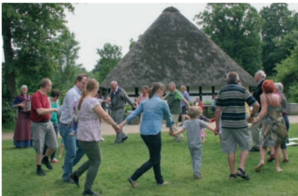
Det lykkes for Gamle Danses Værn at få andre museumsgæster med til dansen på Frilandsmuseet.