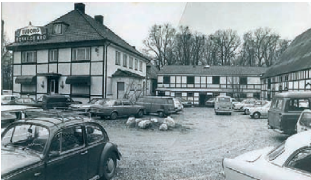
Tuborg-reklamen på taget viser, at vi er i de år, da restauranten var i fuld gang.