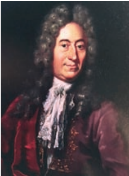
Astronomen Ole Rømer (1644-1710) er sikkert ofte kommet til hest eller med vogn ad den gamle landevej, når han skulle ud til sit landobservatorium ved Kroppedal. (Samtidigt maleri af ukendt kunstner)

Engang var rejser gennem Danmark vanskelige på grund af de få farbare veje. Rejser om natten var selv for bevæbnede folk risikable, så man lagde sin rejserute efter private venner eller klostrene, hvor man kunne få natlogi bag klostres mure, men efter reformationen i 1536 var klostrenes tid forbi, så kongen – der konfiskerede kirkelige ejendomme – måtte selv tage ansvar for rejselivet i landet. Allerede i 1521 kom Christian 2.s forordning om, at der skulle ligge en kro ved landevejene for hver 2 mils rejse, så derfor skulle der ligge en kro i denne afstand fra København. Det blev Roskilde Kro, der ikke ligger i Roskilde, men er Roskildevejens kro.