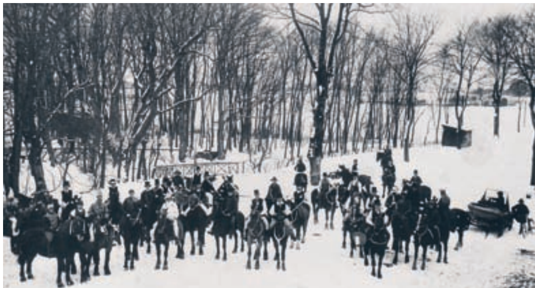
Der holdes fastelavn. Rytterne på udsmykkede heste er klar til at ride rundt til gårde- ne før tøndeslagningen ved Roskilde Kro i 1925.

På Roskilde Kro var en tønne med røde og hvide bånd hængt op, så rytterne måtte rejse sig i sadlerne for at ramme den med køllen. Der skulle fart på hesten og kraft bag køllen for at få tøndens til at revne, så appelsinerne faldt ud, og drengene kunne slå om frugterne. Kattekongen blev hyldet, og derefter skulle man finde en kattedronning blandt damerne, så de slog katten af en tønne i en mere beskeden højde. Kroens folk dækkede op til kaffe i den opvarmede krostue. Fastelavn var ofte en kold søndag i februar.