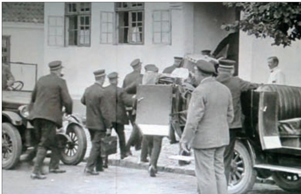
Musikerne stiger ud af bilerne med deres instrumenter. Tjeneren i hvid jakke står ved indgangen til krostuen.