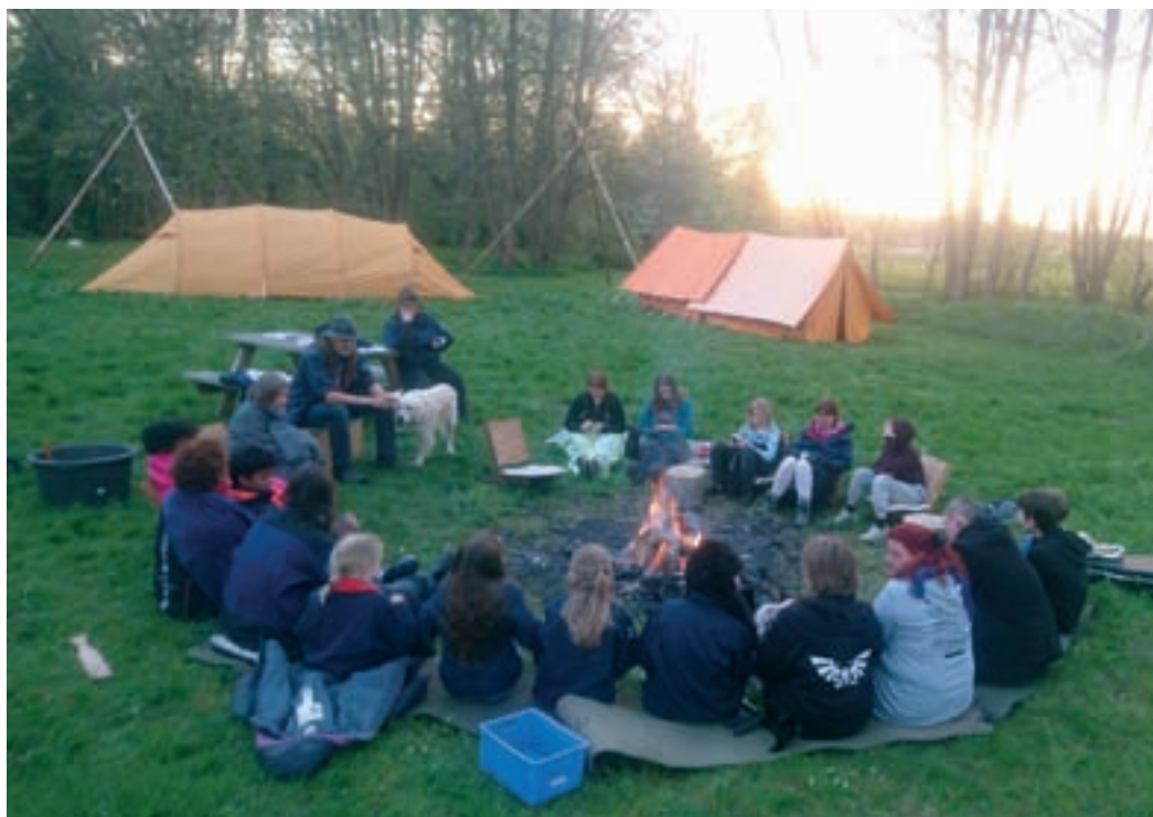
Mens solen går ned en aften i maj, sidder spejderne og nyder at være sammen ved Roskilde Kro.

En lejr er meget mere end telt og bål, når man tænker på de sociale værdier. Ord som "spejderlejr" og "spejderhytte" er begreber, vi alle bruger. Spejderne har også haft lejr med overnatning på Spejdergården. De grønne spejdere valgte maj til en weekend på spejdergården, og de blå spejdere holdt deres i september. De har endda haft besøg af spejdere fra Albertslunds svenske venskabsby, Mölndal, og det var nemt med teltene og bålplads i den gamle kros have.