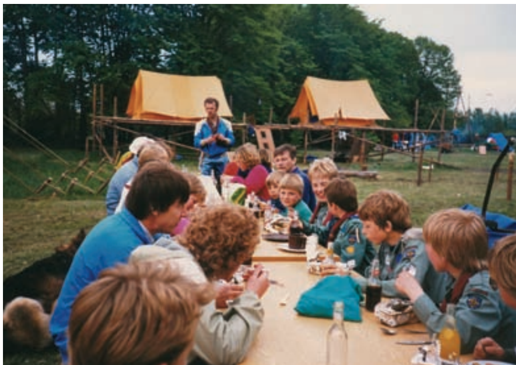
Forældre til spejderne besøger lejrlpladsen foran kroen. (Privatfoto, 1985)