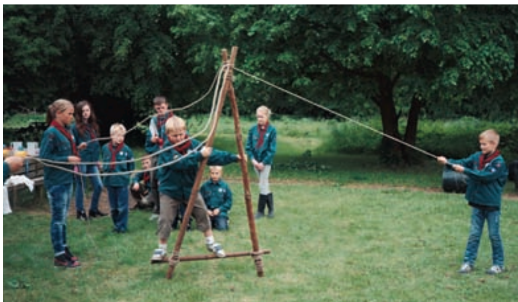
Sådan bygger man en A-buk, og så gælder det om at kunne gå i den. Fire spejdere har dog snor i denne balancegang.