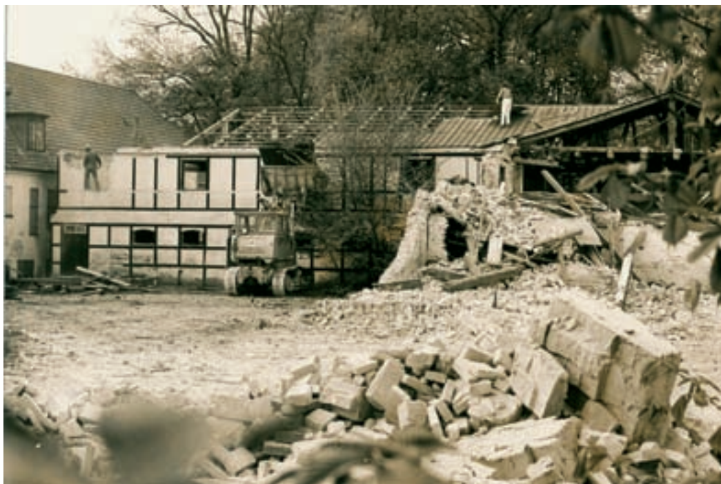
Sidebygningerne rives ned i 1972.

Kommunen havde en plan for kroen. I stueetagen skulle der være lokaler til ungdomsorganisationer. Der ville blive et værksted til en motorklub, og en stald til en rideskole. Desværre var kommunens planer for kroen lidt længe om at blive ført ud i livet. Bygningerne stod i nogle måneder tomme, og det gav anledning til tyveri og hærværk. Tyvene fik fjernet installationer, gulvbrædder, vægbeklædning, radiatorer og et helt tag af eternit på en af bygningerne. Hærværksmænd smadrede spejle, toiletter og vinduer. I efteråret 1972 var det slut med at se kroen ligge øde hen. De gamle stald- og ladebygninger blev revet ned. Der blev afsat 46.000 kr. til nedrivning. Hovedbygningen skulle restaureres for 180.000 kr. Projektering af kroens have ville koste 10.000 kr.