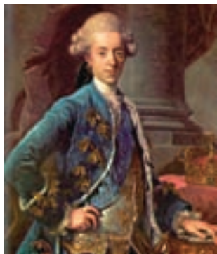
Kong Christian 7. portrætteret i 1768, som var det år den 17-årige konge og hans følge gjorde et ophold på Roskilde Kro. (Maleri Louis Michel van Loo. Frederiksborgmuseet)

I 1768 gjorde Christian 7. et ophold på Roskilde Kro. Det fortæller hofembedsmand, geheimeråd B. Willum Luxdorph i en dagbog, men ellers har der været hverdagstrafik med bøndernes vogne, postdiligencen, vandrende pilgrimme og omstrefjende handelsfolk. (29)