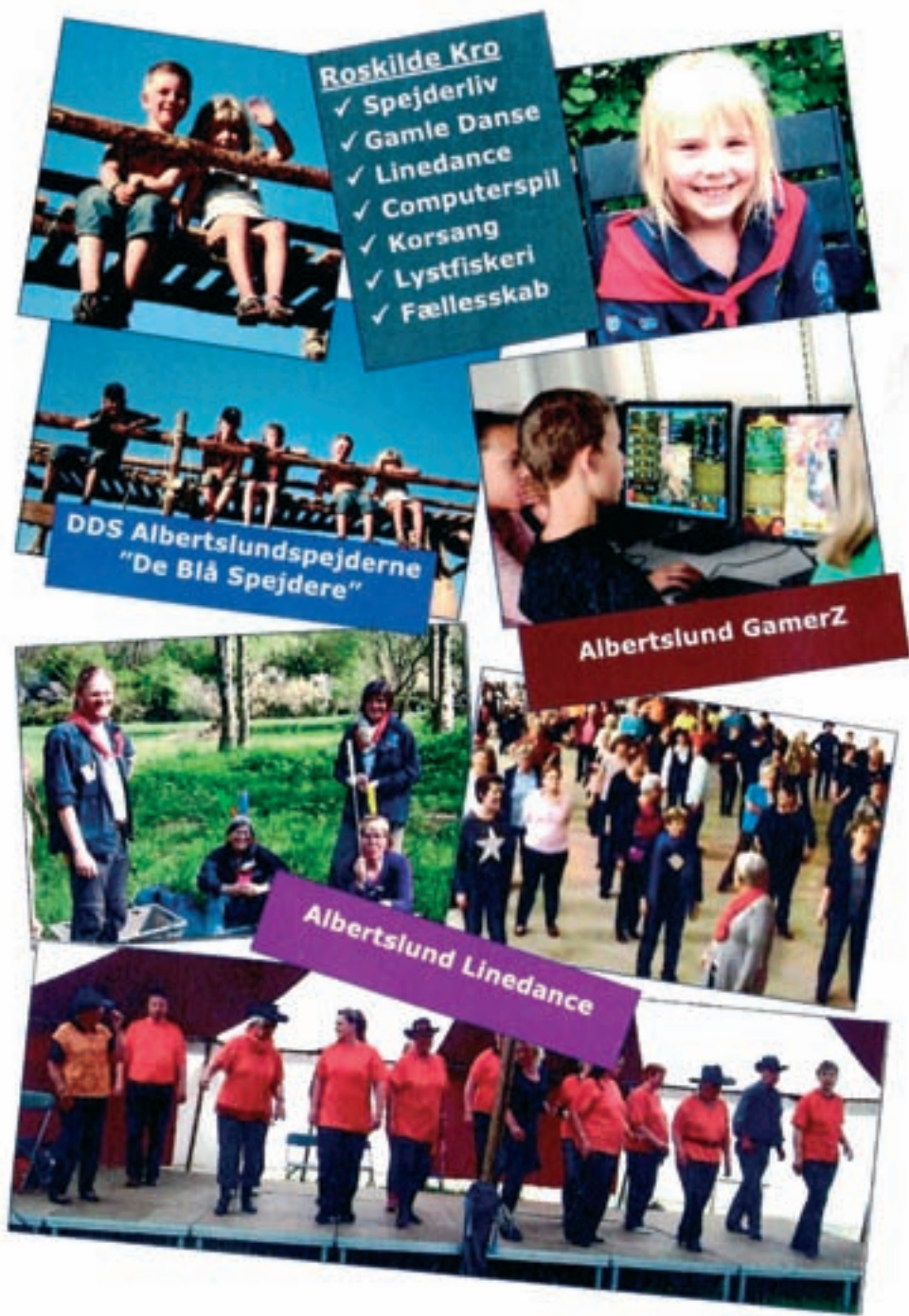
Foreningshuset Roskilde Kro præsenterer sig med de foreninger, der bruger kroens lokaler. Brochuren er en invitation til at melde sig ind. Der er virkelig noget for flere aldersklasser og forskellige interesser. Man bruger Roskilde Kro, men kun som basis. Foreningerne kommer i høj grad også "ud af huset". (Foreningen 2017)