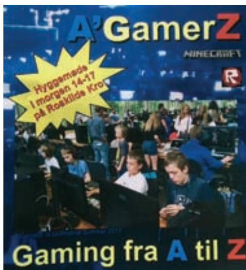
I marts 2017 begyndte Albertslund GamerZ at mødes på Roskilde Kro.

Som ægtefolk siger JA til en fremtid, har Roskilde Kro åbnet sig for fremtidens fritidsliv i Albertslund. Hvad har man gang i? spørger vi. Et svar kunne være: Spørg på Roskilde Kro! I 2017 er en ny forening kommet til kroen. Albertslund GamerZ eller A’GamerZ er en forening for dem, der dyrker spil på computeren. Her kan børn, unge og ældre mødes søndag eftermiddag i krosalen og dyrke deres fælles interesse på medbragte computere. De spiller med og mod hinanden, og forbereder konkurrencer med andre hold og har også fokus på kost og fysisk træning. Man vil gerne arbejde med at programmere, producere grafik og videoer samt streaming. Er Roskilde Kro efterhånden blevet en ældre dame, må man dog sige, at hun følger med tiden.