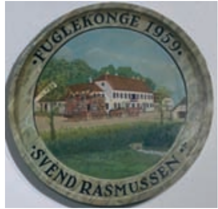
Fuglekongen får dekoreret en skydeskive til minde. Her har en fuglekonge valgt Roskilde Kro som motiv.