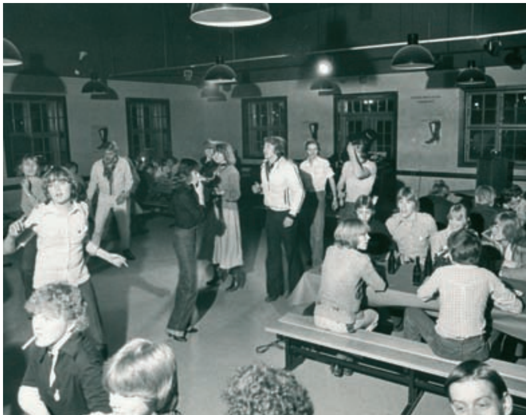
Ungdommen danser til tidens musik i 1978.

denne pressemeddelelse: "Der er fuldt drøn på, når "Molino" spiller. Det er musik for rågummisko og pomadehår. Flippere og diskere får ikke et ben til jorden". Albertslund Posten omtalte de kommende bands, så de unge vidste, hvad de kunne glæde sig til.