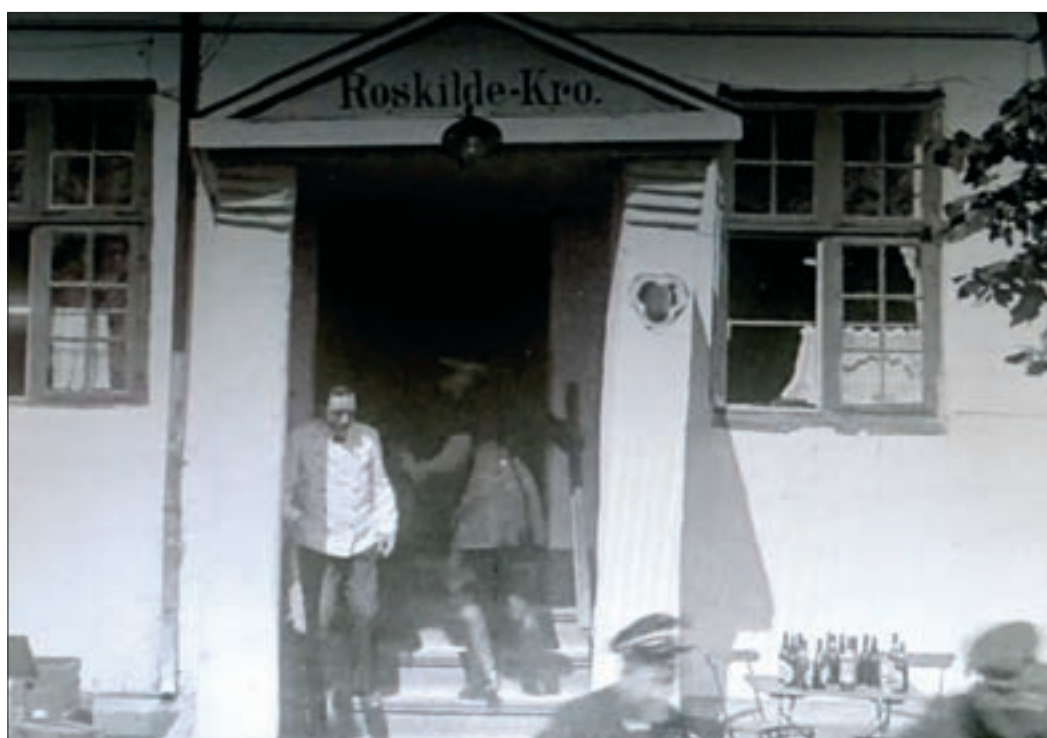
Da de støjende gæster er smidt ud af krostuen, kommer tjeneren frem i døren og glæder sig til at få kroens fredelige hygge tilbage.