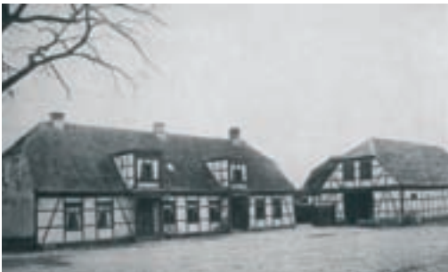
Taastrup Nykro med rejsestald. Kroen ejedes af Roskilde Kros ejer indtil 1894.

og her skulle det vise sig, at Roskilde Kro fik en ny værdi som samlingssted for det lokale samfund. (29)