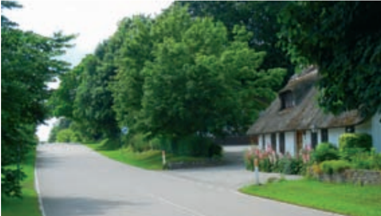
Rolighedshuset ligger på den grund, hvor Roskilde Kro lå indtil ca. 1770. (J.N. 2016)

vej fra hovedstaden mod Roskilde. Man er kommet over vadestedet, Appevad, og derefter op til kroen. Efter ophold kunne man drage videre i det skovløse terræn og få øje på Snubbekorset som et sigtepunkt i horisonten.