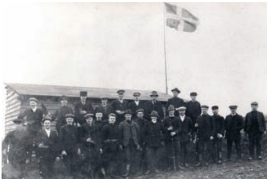
Skytterne foran skydepavillonen syd for Roskildevej.

Zakarias Nielsen medvirkede til, at skytteforeningen fik meget andet end skydning på programmet. Han fik foredragsholdere ud til kroen. Forfattere, folketingsmænd, præster og højskolefolk talte uden vederlag. Det nye folkestyre skulle have næring gennem debat. Zakarias Nielsen skrev senere: