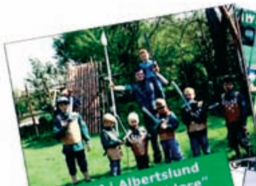
KFUM i Albertslund "De Grønne spejdere"