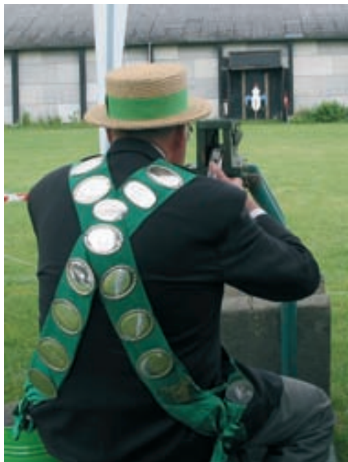
Sidste års fuglekonge bærer over skuldrene bæltet med fuglekongernes navne og skyder det første skud mod papegøjen.