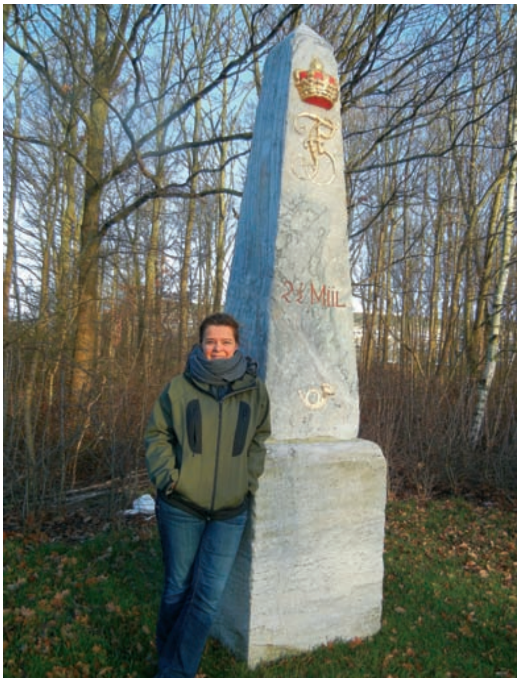
Ved den nye Roskildevej blev der i 1778-82 opstillet milepæle i norsk marmor. De eguede sig ikke til dansk klima, så de forvitrede og blev i 1840'erne erstattet af granitkegler. En af de gamle milepæle er nu restaureret og genopstillet på sin oprindelige plads på Roskildevej mellem Hveen Boulevard og Halland Boulevard. (J.N. 2016)