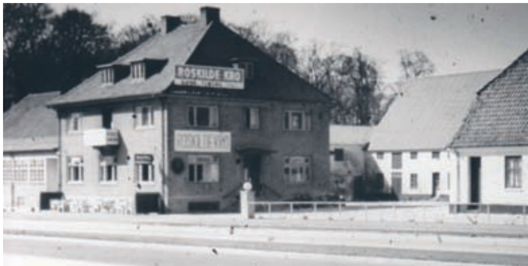
Roskilde Kro ca. 1950.