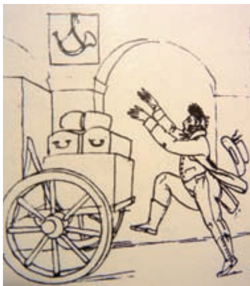
Oehlenschläger er ved at komme for sent til diligencen. (Tegning af Fr. Tieck 1807. Det Kgl. Bibl.)