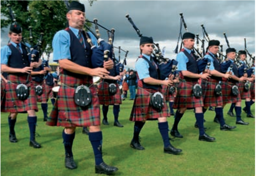
White Hackle Pipe Band hørtes sidst på eftermiddagen, når de øvede sig ved Roskilde Kro i 1974.

i 3 år og optrådte som tambourkorps ca. 50 gange om året. Enten åbnede de kroens vinduer, når de spillede indendørs, eller også stod de på græsplænen foran kroen, for beboerne på de omliggende villaveje hørte dem. Man nikkede til hinanden: "Nå, nu øver de igen!" Ikke alle syntes lige godt om den kontinuerligt bølgende strøm af høje toner. En femårig pige sang selv "Se, den lille kattekilling", og da hun fra en have i Albertslund Vest hørte sækkepipernes gennemtrængende musik fra Roskilde Kro, kom denne replik: "Det er da en underlig kattekilling, de spiller!" (7)