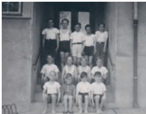
Drengene har sat sig på trappen til krosalen, før de skal ind og træne med gymnastik i 1947.