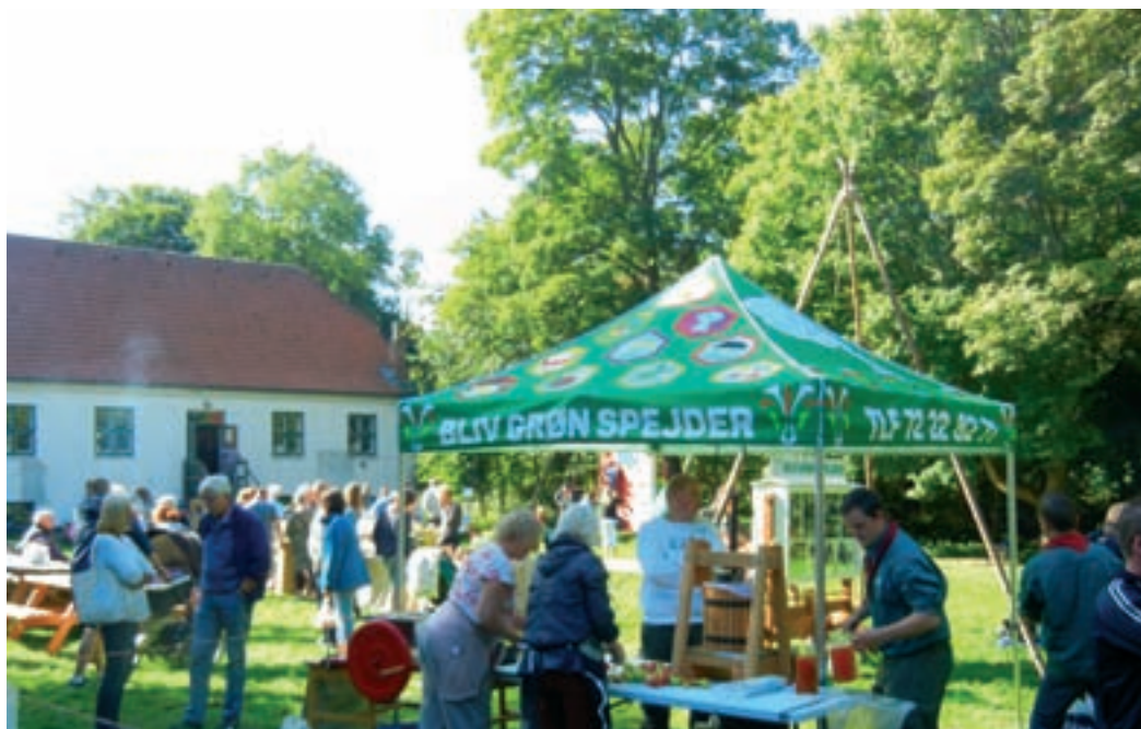
Høsttid er markedstid for Foreningshuset Roskilde Kro. (J.N. 2016)