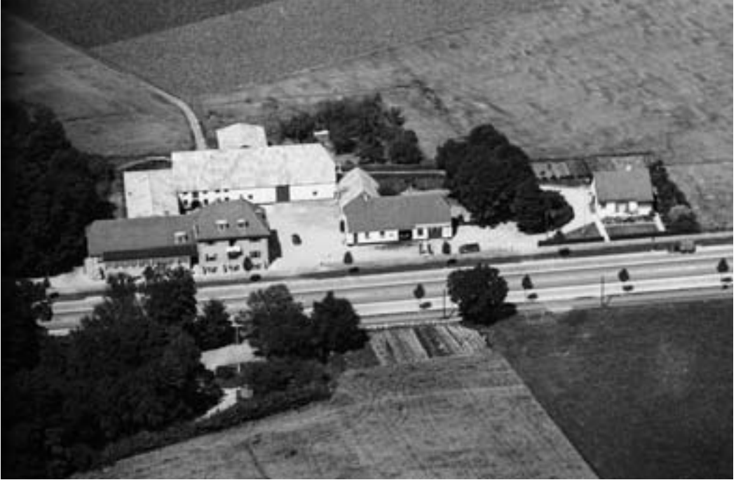
Kroen i 1949. Til højre ses villaen "Bangs Minde".