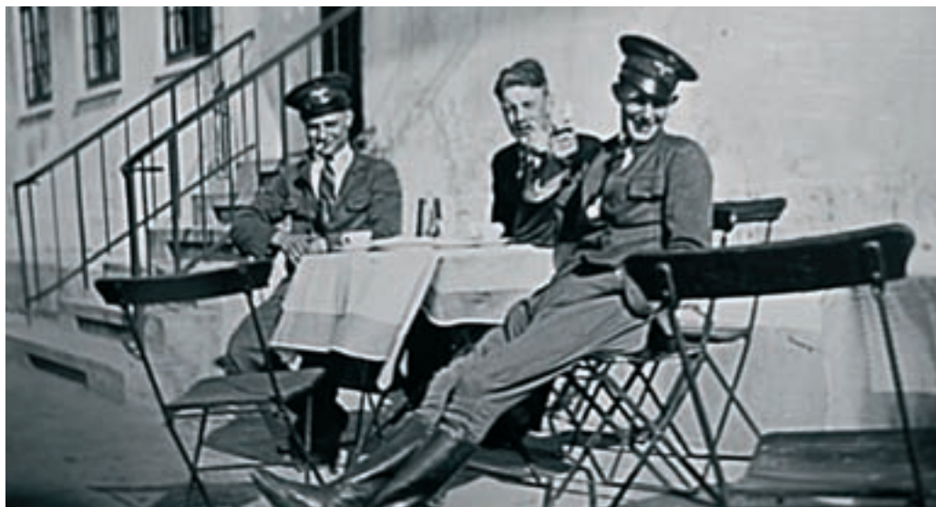
Buschauffører havde uniform, kasket og langskaftede støvler. De holder her pause ved kroen en sommerdag i slutningen af 1930'erne.

Den første rutebil kørte i 1927 fra Valby til Taastrup. Folk gik tidligere ad Roskildevej, når de fra Herstederne skulle til slagteren i Glostrup eller en forretning i Taastrup. Nu kunne man tage bussen. De Røde Rutebiler havde stoppested ved Roskilde Kro og ved Bomhuset over for kroen. Busserne kørte fra Valby Langgade til Rugkærgårdsvej i Taastrup. Da der blev hyppigere togafgange, hændte det, at der ikke var flere passagerer med, når bussen nåede til Roskilde Kro. Det fortælles, at en buschauffør en dag i 1950'erne havde en tom bus, så han kørte ind på kroen og parkerede bussen ved laden, så ingen kunne se, at han i arbejdstiden