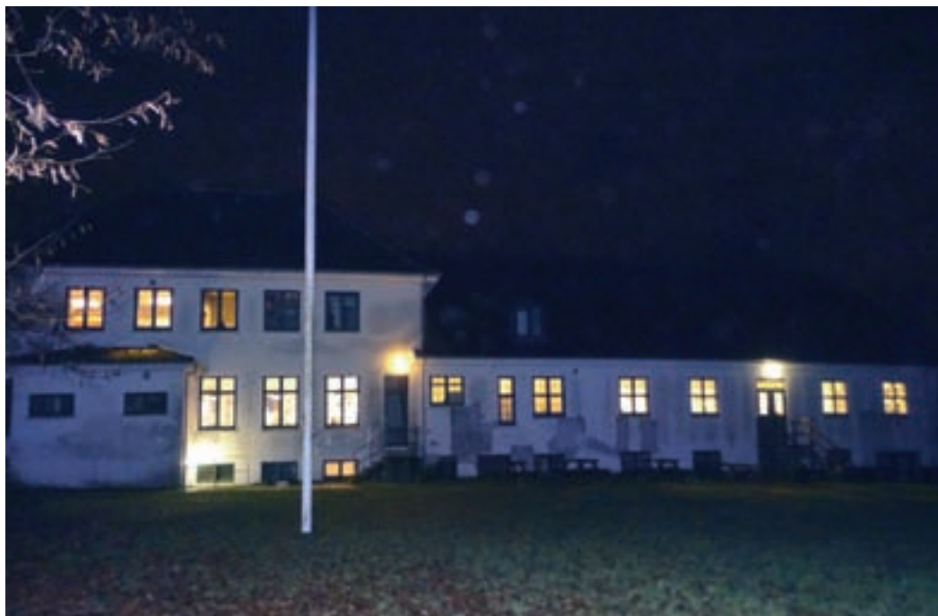
Selv en mørk aften ser man liv og lys ved Roskilde Kro.

nen, som opfordring til "ta' selv", så det var en af grundene til ophøret. Heldigvis kommer der igen salg af juletræer ved Roskilde Kro, for det genindfører Foreningshuset Roskilde Kro.