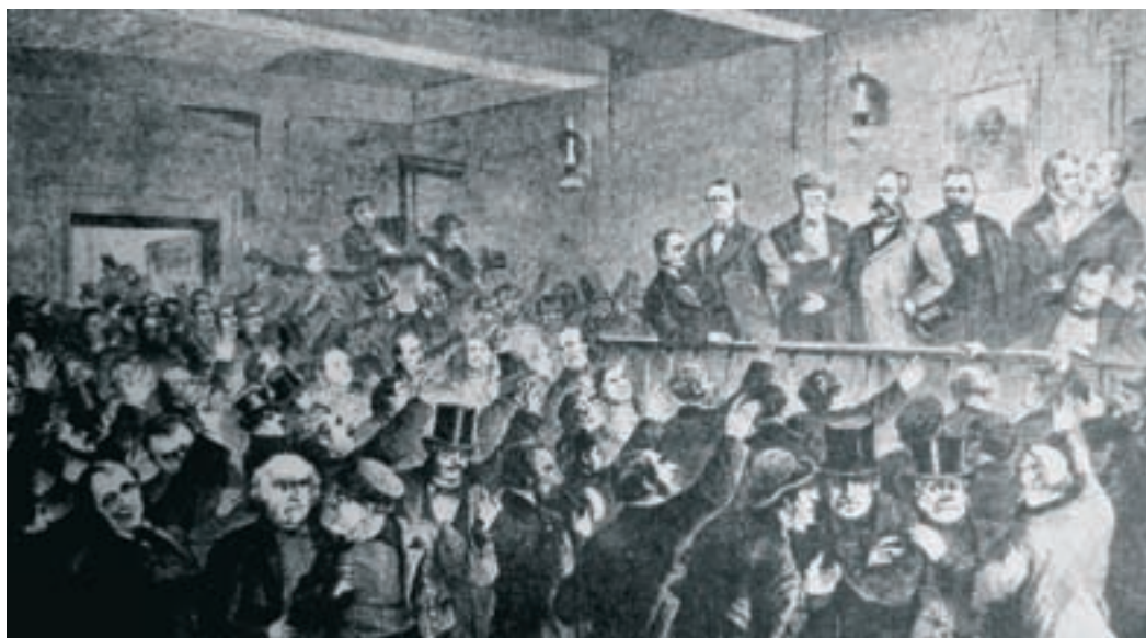
Vælgermøde i sjællandsk krostue.