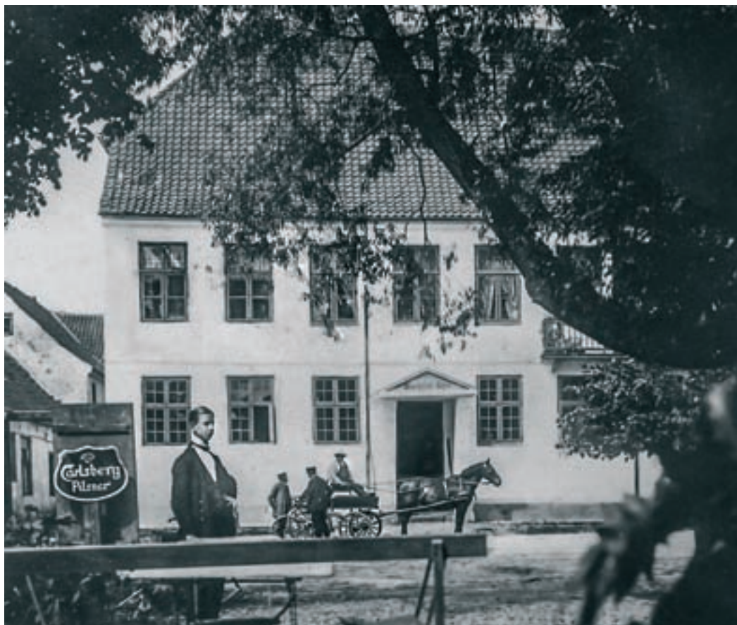
På en sommerdag var kroen og haven over for kroen et yndet udflugtsmål. Her står tjeneren i forgrunden parat til at betjene gæsterne.

Efter koncerten afholdtes en animeret fællesspisning, hvor der naturligvis blev holdt en mængde taler og sunget flere sange. Festen afsluttedes med et bal.”