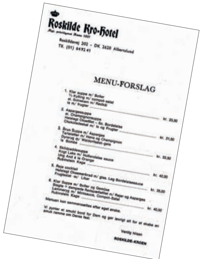
Menukort fra Roskilde Kro.