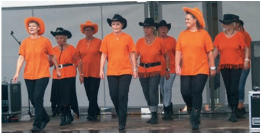
Albertslund Linedance i hopla på scenen på Stationstorvet, hvor der holdes Foreningernes Dag.

Krosalen på Roskilde Kro er fuld af glade mennesker, når Albertslund Linedance er ved at være klar til deres ugentlige dansedag, og kroen har været deres "hjem" siden 2008. Smil og latter lyder da alle lige skal hilse på hinanden og snakken stopper først, når musikken starter. Noder og G-nøgler pryder salens vægge, og på gulvet bevæger danserne sig rundt. Der danses til countrymusik, men dansk pop og populærmusik er også en del af programmet.