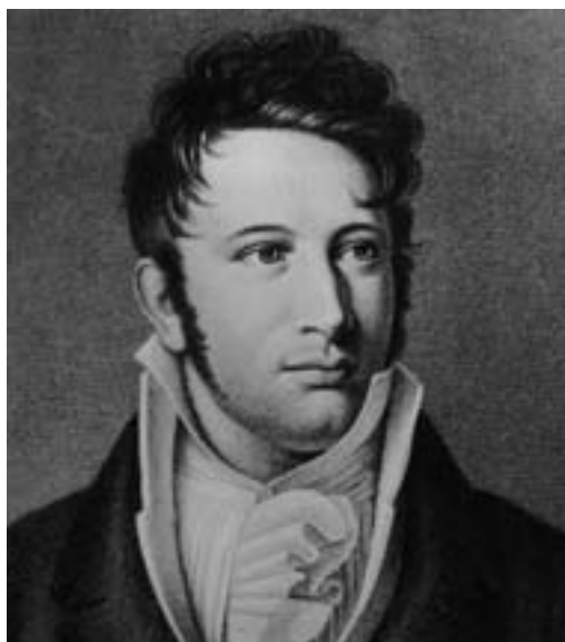
Digteren Adam Oehlenschläger. Et portræt lavet tre år efter hans ophold på Roskilde Kro. (Maleri af J.L. Lund, 1807)

Indtil 1847 var Roskildevej den bedste mulighed for rejsende mellem hovedstaden og Roskilde, indtil jernbanen kom, så det betød, at også de kendte danskere kom her. Flere af de kendte har kommenteret deres besøg på Roskilde Kro. Nogle år før han skrev vores nationalsang, var Adam Oehlenschläger på Roskilde Kro, da han i 1804 var på vej til Langeland. Han bestilte et måltid og fik bl.a. serveret skinke. Senere beskrev han denne smagsoplevelse: ”..skinken var sej som et bræt, så den kunne have tjent som skilt på værtshuset”.