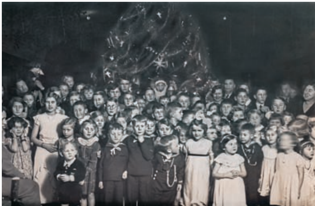
Juletræsfest for fængselsfunktionærernes børn i 1935.