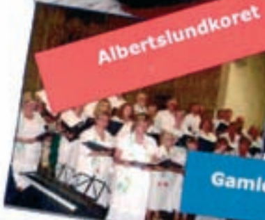
Gamle Danses Værn