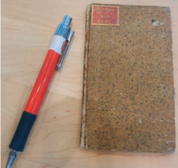
Hofboghandler J.L. Beekens bog er ikke stor, men heri findes hans beskrivelse af besøget på Roskilde Kro. (J.N.2017)a

vægge og stolper er oversmurt med slige vittigheder, og det vil vel næppe vare længe, før lofterne får samme skæbne." (2)