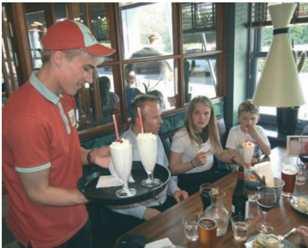
Wittrup Motel med Sallie's Snack Bar har bevaret den amerikanske stil fra 1955. Menu, interiør og servering minder om dengang. (J.N.2017)