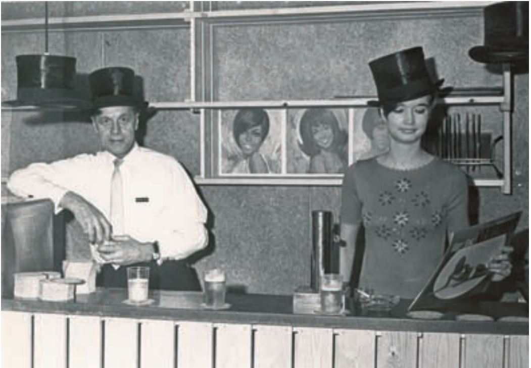
Diskoteket "Black Hat" var en fornyelse på kroen i 1960'erne.