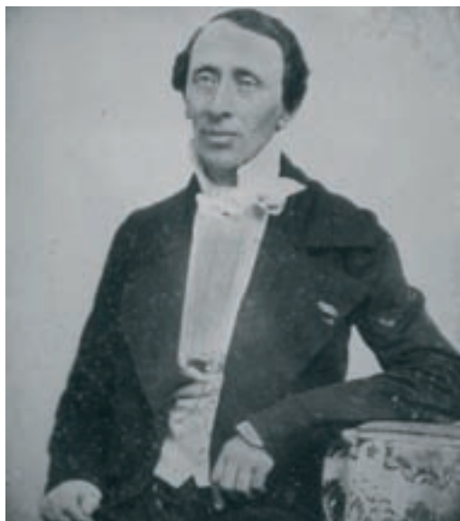
H.C. Andersen. (Daguerreotopi 1846-47)