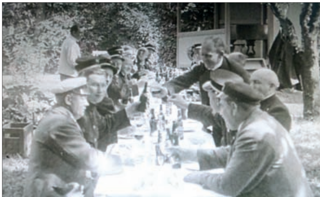
Nogle foretrækker at sidde i kroens have. En tjener sørger for rigeligt at drikke. Musikerne har spurvejsuniform på. Et par herrer med kasketter, som man brugte i sangforeningen, får lyst til at deltage i spurvejsfunktionærernes festlighed.