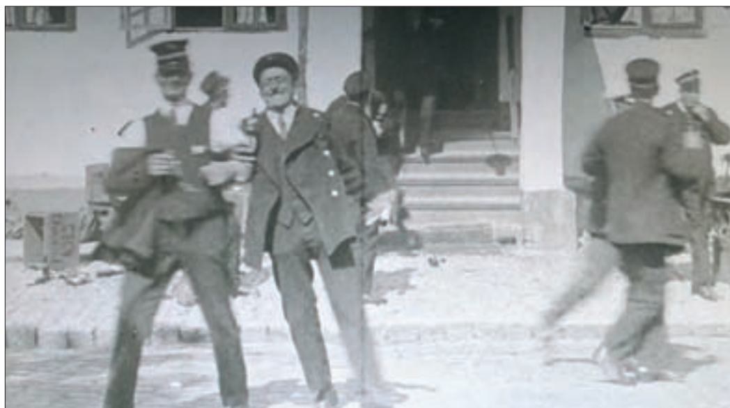
To sporvejsfunktionærer spiller berusede og forlader kroen lystigt syngende med kasketten noget ureglementeret på hovedet.