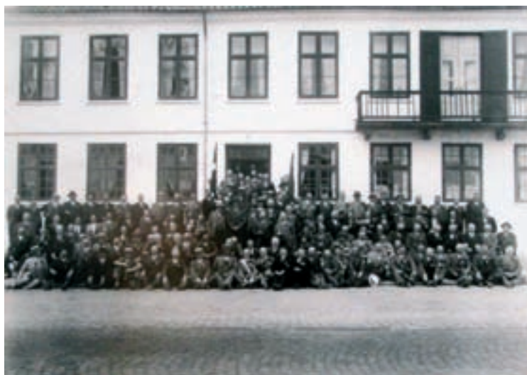
Skydebrødrene fra fugleskydningsselskabet er samlet foran kroen i 1934. Dengang var Roskildevej brolagt.

men ret tæt på byen og domstolene. Fængslet betød arbejdspladser og lidt flere lokale beboere. Måske fik man i Herstederne ikke en overklasse som i Taastrup, men fængselsbetjente havde som statsansatte med pension en vis status. Netop i fængslets indvielsesår blev der stiftet en forening for mænd af det bedre borgerskab, som f.eks. bankbestyrer, købmand, slagtermester, direktør, gårdejer og postmester. Det var Taastrup og Omegns Fugleskydningsselskab af 1859 , som var en forening, man skulle ansøge om at blive medlem af. Medlemstallet var begrænset, og man kunne kun optages med anbefaling fra andre skydebrødre.