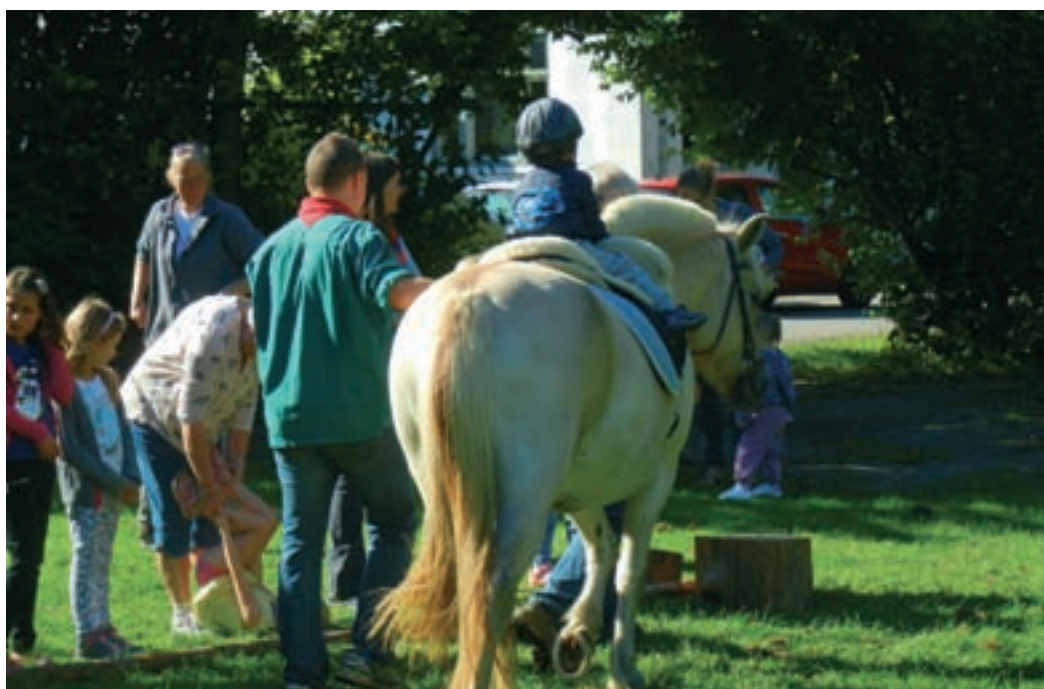
En ridetur på en hest fra Dyregården er et godt tilbud for børnene på høstmarkedet. En spejder sørger for, at det bliver en behagelig og sikker tur. (J.N. 2016)