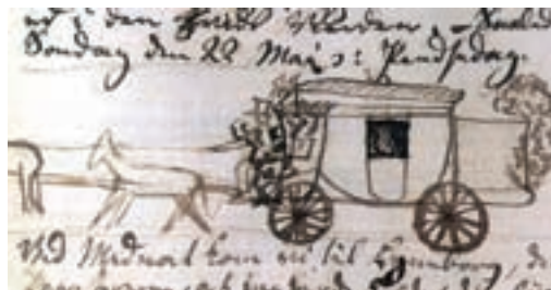
H.C. Andersen skrev dagbog og breve med indtryk fra hans mange rejser. Her har han i 1831 tilføjet en skitse i et brev.