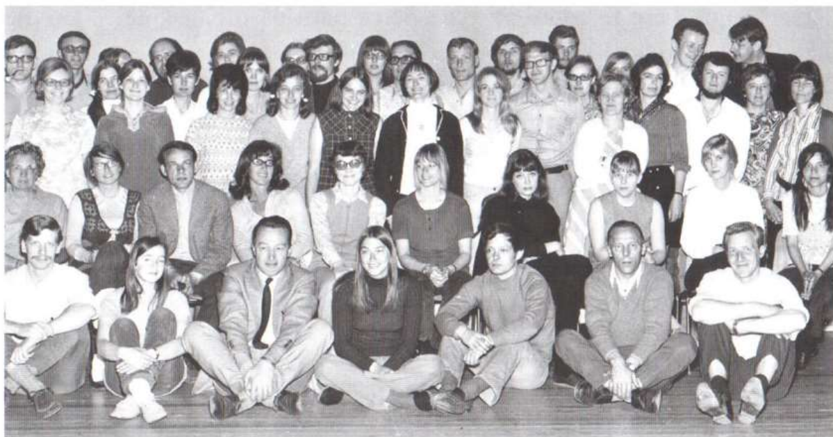
Lærerkollegiet 1971.

Skolehuse i Albertslund. Albertslund: Fællessamlingen, 1989 (Video: VHS og DVD). Lokalhistorisk Samling