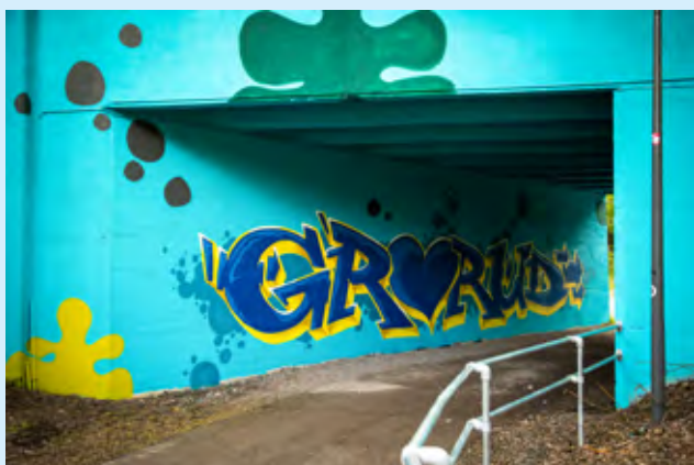
Grommerudtunellen: Undergangen mellom Alnaelva og Grorud t-baneperrong har blitt freshet opp av Oslo Spray Service tunellen, inspirert av Knut Steen.