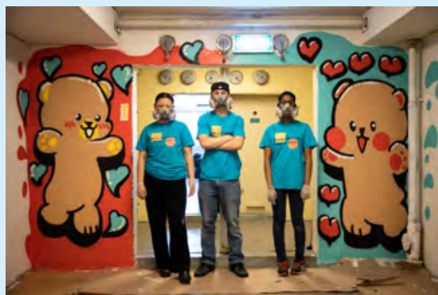
Groruddalen skole: I miljørommet på Groruddalen skole kan du se resultatet av et grafittkurs holdt av «DekorTron» for elever ved skolen i samarbeid med Jobb for ungdom.