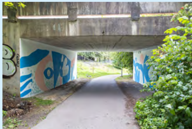
Undergang på Ammerud: Den flotte undergangen ved Ammerudklubben er laget av ungdommer på klubben, elever fra Ammerud skole og kunstnerne i Heiaklubben.