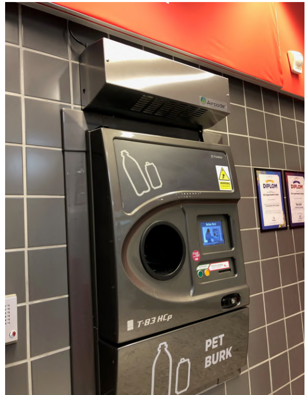
Aircode™ CX-100 - Returglasrum utsida