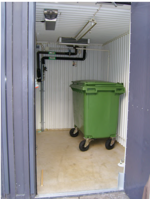
Aircode™ CX-100 - Kylt soprum