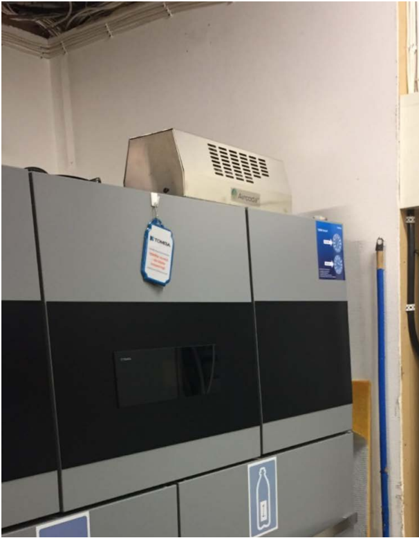
Aircode™ CX-200 - Returglasrum insida