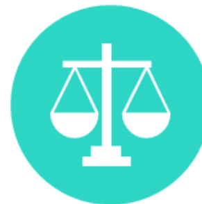
Forsvarere og retsmæglere