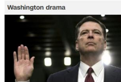
Fired FBI chief's hearing: 10 things we learned