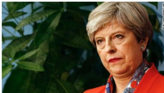
Britain delivers stunning blow to PM Theresa May after left-wing surge