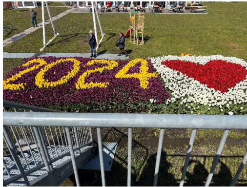
"kunstværk af afklippede tulipanhoveder"

Sidste besøg var på Meyer Werft som ligger ved Elben – de bygger meget store krydstogtskibe med helt op til 4.000-10.000 mennesker ombord – endda 4 ad gangen! Det var også et interessant besøg. Tænk, det er som at bygge med megastore legoklodser – man tager "bare" en sektion ad gangen og stabler dem ovenpå hinanden – wauw! Man samler nogle af dækkene "på hovedet" og vender det hele når det er klart! Det var også spændende at høre og se en film om, hvordan de kæmpestore skibe bakker ud gennem Elben et langt stykke på den relativt smalle flod, inden de vender og sejler forlæns den lange vej ud til Nordsøen, men tror jo ikke sine egne øjne, når der kommer sådan en klods sejlene på en relativt (nogle steder!) smal flod, men det er sådan de gør!