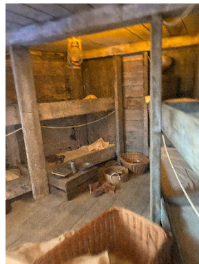
"Et af skibene, man sejlede udvandrerne til bla. USA i"

Der var bryllup på hotellet den første nat, så vi blev henvist til restaurant Aan di Dijk, flot restaurant som ligger på diget med udsigt over floden ca. 10 km fra hotellet.