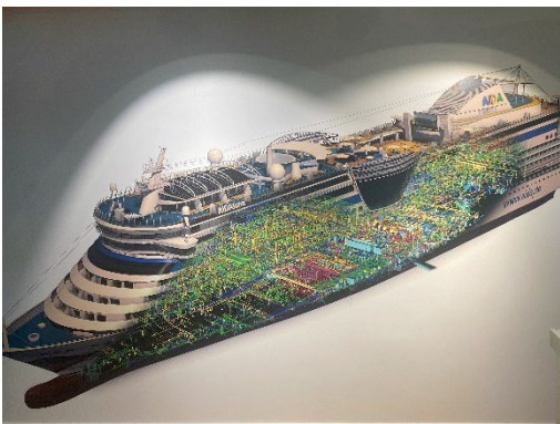
"model hvor man kan se hvor meget indmad, der er i et krydstogtskib!"

Sidste besøg var på Meyer Werft som ligger ved Elben – de bygger meget store krydstogtskibe med helt op til 4.000-10.000 mennesker ombord – endda 4 ad gangen! Det var også et interessant besøg. Tænk, det er som at bygge med megastore legoklodser – man tager "bare" en sektion ad gangen og stabler dem ovenpå hinanden – wauw! Man samler nogle af dækkene "på hovedet" og vender det hele når det er klart! Det var også spændende at høre og se en film om, hvordan de kæmpestore skibe bakker ud gennem Elben et langt stykke på den relativt smalle flod, inden de vender og sejler forlæns den lange vej ud til Nordsøen, men tror jo ikke sine egne øjne, når der kommer sådan en klods sejlene på en relativt (nogle steder!) smal flod, men det er sådan de gør!