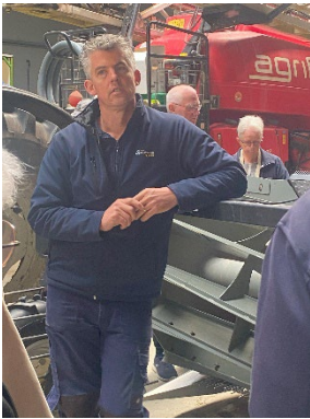
"Sønnen på tulipan-fabrikken"