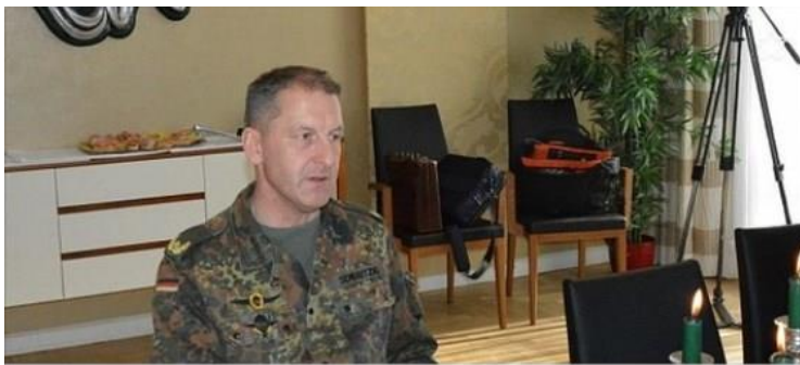
Kommandeur der Gebirgsjägerbrigade 23 wird Stabschef bei der US Army Europe

“Patrioten: Seid vorsichtig mit Euren Interpretationen der veröffentlichten Informationen. Falsche Erwartungen und deren Vortrieb, basierend auf ‚Spekulation‘, werden nur jene bewaffnen, welche uns angreifen [MSM].