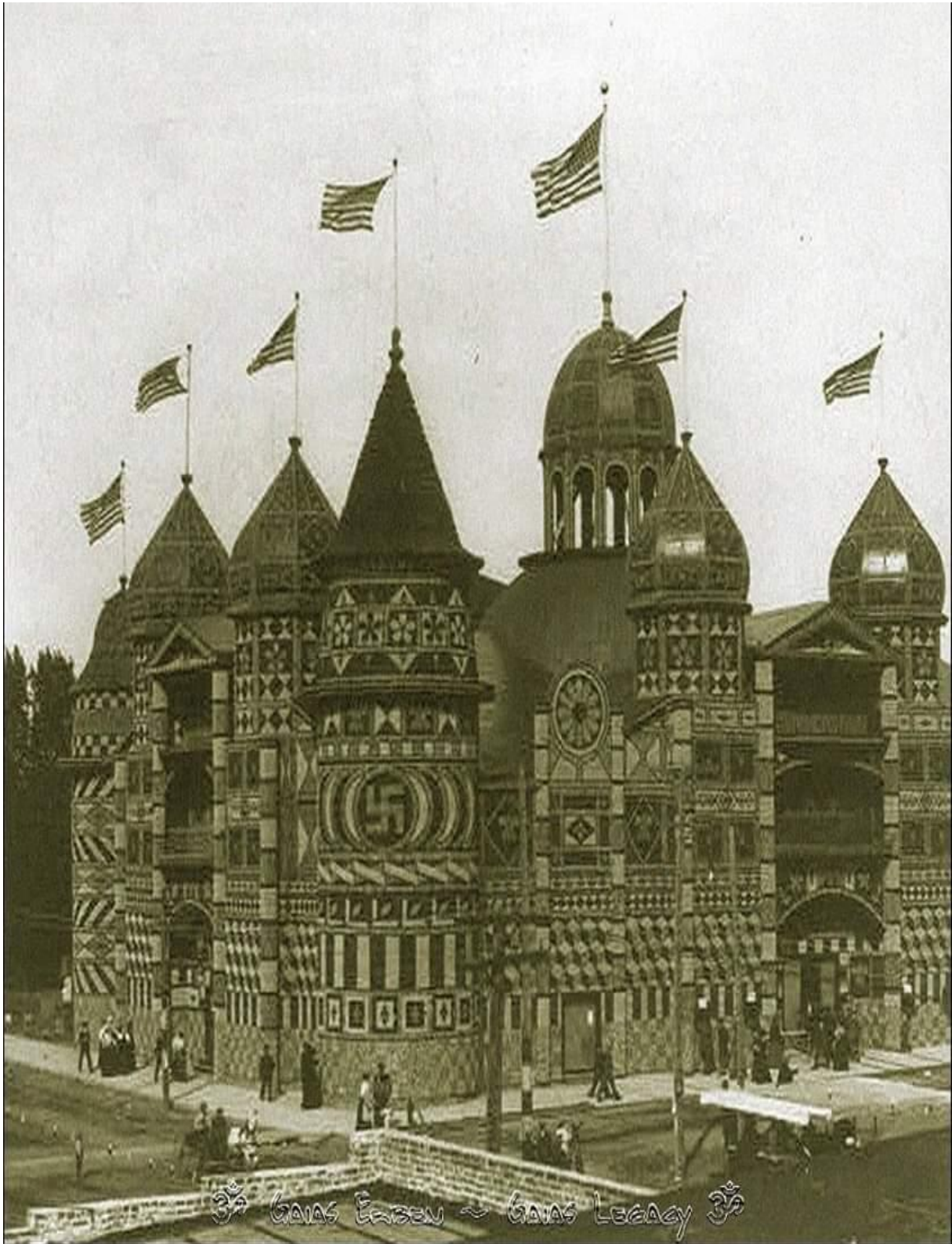
The Corn Palace in Mitchell, South Dakota (USA), 1907