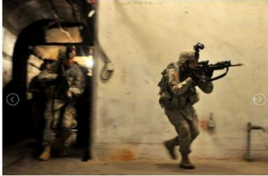
Ironhawk Troop raids a tunnel complex during training at West Fort Hood. This was part of a larger training operation that included recon missions, air movement and live-fire.