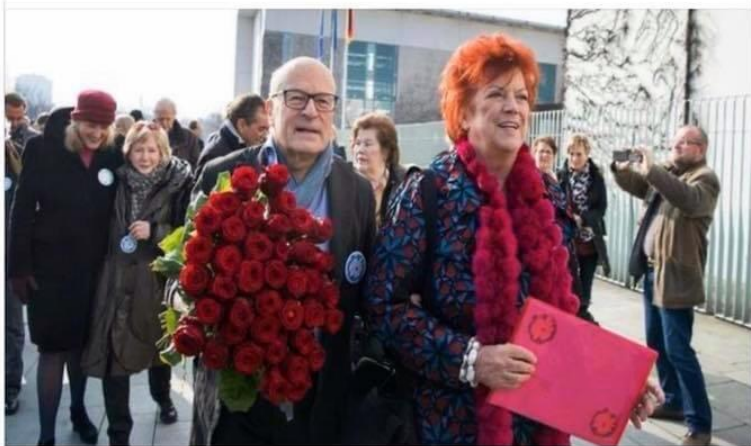
TAGESSPIEGEL.DE Rote Rosen für Angela Merkel Sie wollten sich bedanken für Angela Merkels "Wir schaffen das": Regina Ziegler, Volker...

Zu den zahlreichen prominenten Unterzeichnern gehören auch Daniel Barenboim, Iris Berben, Senta Berger, David Chipperfield, Veronica Ferres, Maria Furtwängler, Elke Heidenreich, Nico Hoffmann, Dieter Kosslick, Jan Josef Liefers, Marius Müller-Westernhagen, Thomas Ostermeier, Hans Neuenfels, Til Schweiger und Wim Wenders.