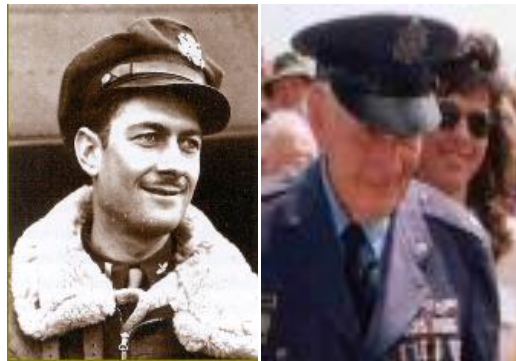
Piloten Clay i 1944

De vendte efter krigen tilbage til USA, hvor flere af dem fortsatte i det amerikanske militær, og andre drog tilbage til den civile tilværelse, som de havde forladt grundet krigen.