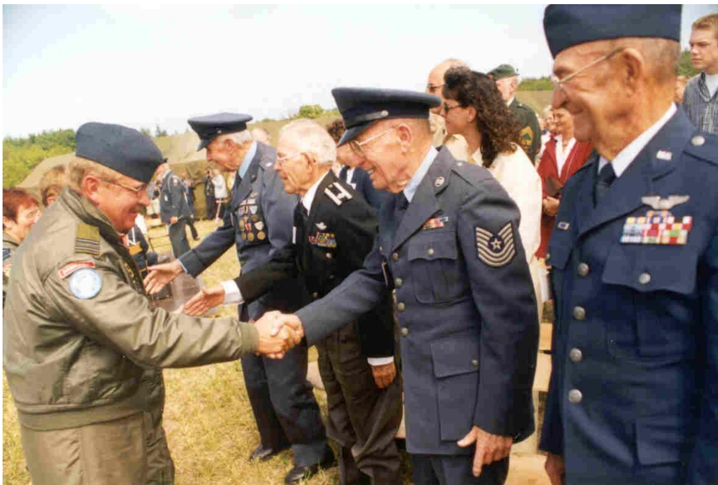
Fire mand tilbage 57 år efter styrtet – 24. maj 2001