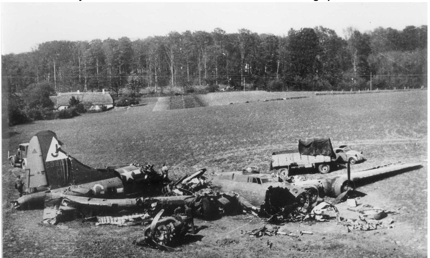
B17 Stormy Weather som vrug på marken nær Nørreskoven på Als