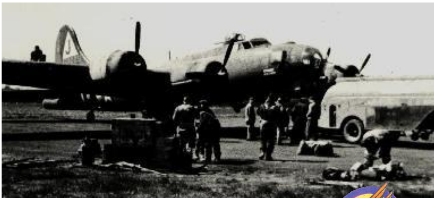
Stormy Weather på basen i foråret 1944. Flyet tilhørte 509. squadron.

Bombemaskinen kom ind fra nordvest og fløj ned langs Nørreskoven. Otte besætningsmedlemmer sprang ud i faldskærm. En mand nordøst for Svenstrup, to mand i Svenstrup og fem mand ved Klingbjerg øst for Svenstrup. Bombemaskinen fortsatte 6,2 km, efter at de otte mand havde forladt maskinen. Piloten og co-piloten nødlandede Stormy Weather på marken øst for Skærtoft afmærket med rødt kryds i cirkel.