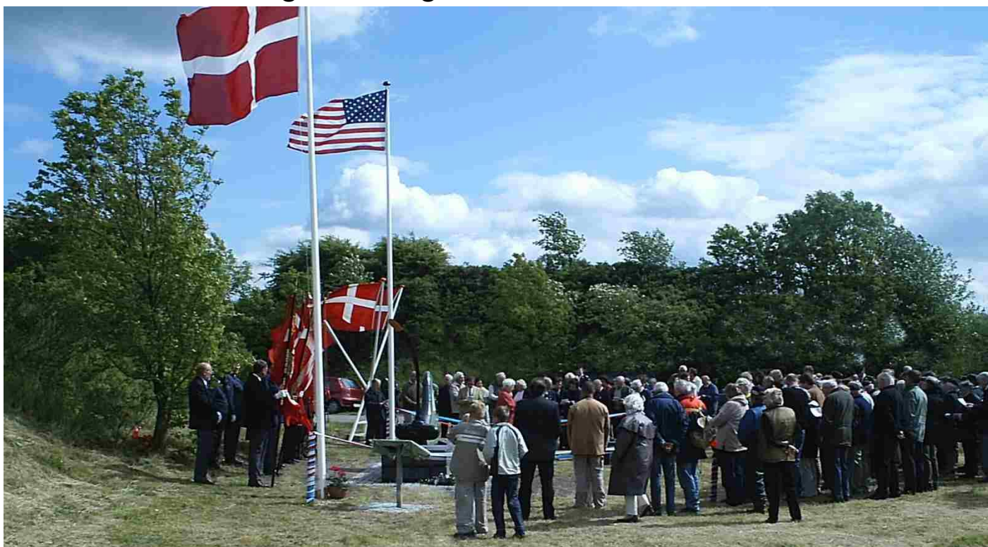
Glimt fra 60-års dagen. Ca. 130 personer overværede afsløringen af det nuværende mindesmærke nær stedet hvor Stormy Weather styrtede 24. maj 1944