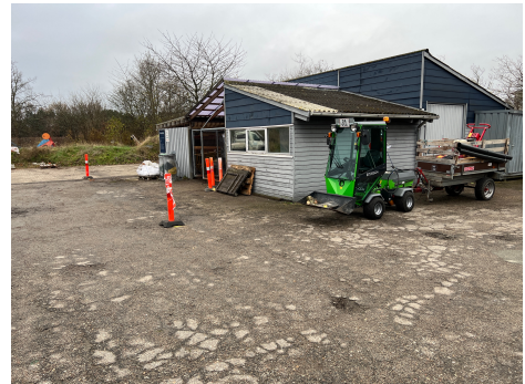
De to kegler markerer hvor hegnet sættes op

forsikringssselskabet om det. Hvis der ikke bliver gjort noget, og der kommer flere indbrud, kan det have konsekvenser for vores forsikringer. Jeg fik ikke spurgt til tidshorisont, og det er ikke til forhandling.