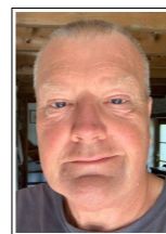
by / par John Rouse

AFA's objectives of promoting integration and appreciation of our local area were fulfilled with the recent car rally. As an organiser of any event will tell you planning is of great importance. One thing that cannot be guaranteed is the weather but there was no need to worry as despite a chilly start it was bright and sunny. As a novice to this event I was not confident that I would take full advantage of the objectives but that was soon made easier because the team members in each car were a deliberate mixture of Anglo/French to ensure we were all able to fully understand the information on offer. We had not met our fellow team member before however during the day we got to know each other better which fulfilled another objective. Having received full but easy to follow instructions our journey began on foot searching out answers to clues, some more difficult than others.