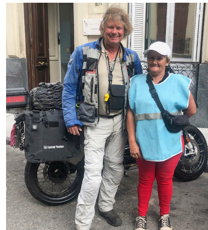
Montevideo har verdens beste parkeringsvakt!

Fra Montevideo er det bare en fergetur over til Buenos Aires på den andre siden av bukta. På flyplassen ventet Dakar Motos, som stropet La Vaca på et par paller, surret henne med krympeplast og satte henne på flyet til Los Angeles. Et par dager senere fulgte jeg etter. En uke hos familien sør i California, og så var det over. Et fantastisk år på reise, fri fra vinter, jobb og forpliktelser. Jeg skulle gjerne gjort det igjen. Dette var slutten på historien. Takk for følget!