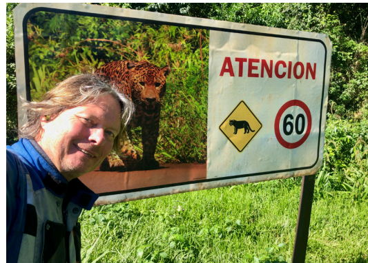
Litt mer eksotiske enn elgskilt

Det er minst like øde på den argentinske siden av grensen som på den chilenske. En enslig vei går sørover, så langt som det går vei her på planeten. Denne delen av Ruta 40 er beryktet for ekstrem sidevind, støtdempredpende vaskebrett, dyp løssgrus og hensynsløse lastebilsjåførere. I enden, tre dager unna, er det bare Ushuaia,