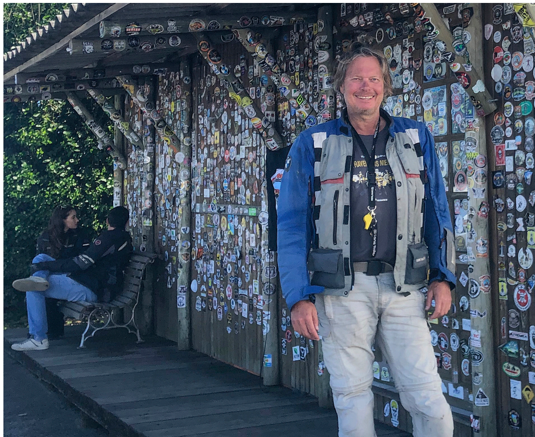
Brasils bikere møtes og klistrer merket sitt på toppen av heftige Serra do Rioe do Rastro – 284 svinger på 1421 meter, rett opp.

beskrevet av de fleste som et kaldt og nitrist høll som ikke har stort annet å by på enn et skilt hvor