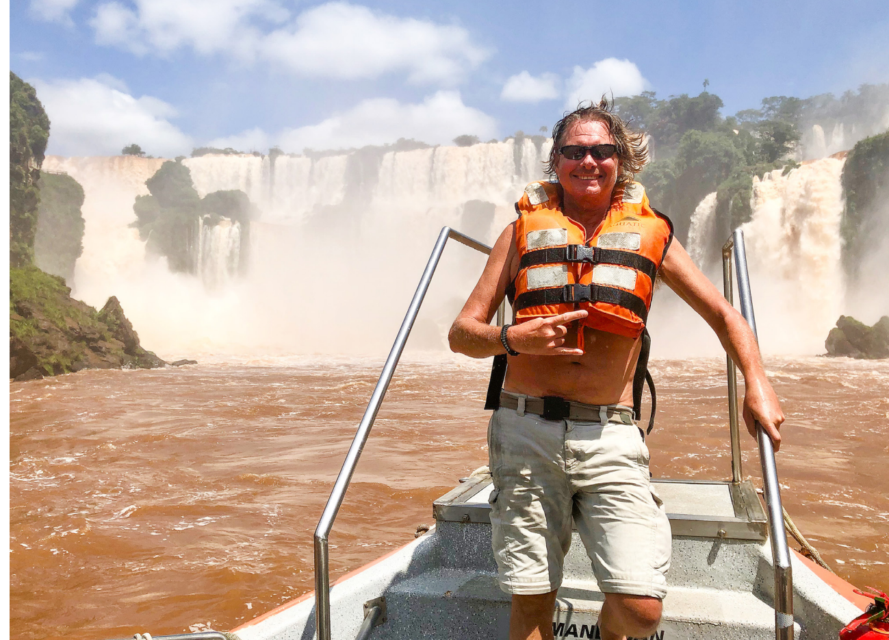
Ribtur er must hvis du kommer til Iguaza Falls!

man kan sette klistremerket sitt og ta en selfie.