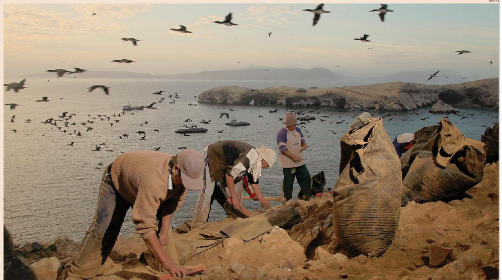
La «raccolta». Lavoratori grattano le pietre per ottenere il guano, uno dei migliori fertilizzanti naturali al mondo, nell'isola di Ballestas, in Perù, una delle 22 isole nelle quali si raccoglie

I due libri di Alessandro Giraudo sulle materie prime sono editi da add editore . Una raccolta di vicende di gustosa lettura e precisione scientifica che ci introduce alle avventure delle materie prime