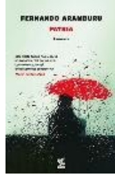
Patria di Fernando Aramburu (Guanda)