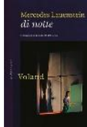
Di notte di Mercedes Lauenstein (Voland)

letto da Chiara Sessa Il fotografo Carlos Spottorno, 46 anni, e il giornalista Guillermo Abril, 36, hanno viaggiato 3 anni lungo le frontiere dell'Europa, chiuse da chilometri di filo spinato e sorvegliate dalle telecamere per impedire l'accesso dei migranti. Hanno scattato 25.000 foto, riempito 15 quaderni di appunti, vinto insieme un World Press Photo nel 2015. E hanno trasformato la loro esperienza in una graphic novel che racconta con la forza delle immagini cosa succede ai confini del nostro continente. Lo regalo a... l'amico con cui condivido l'amore per le graphic novel, ma non l'idea che «bisogna aiutarli a casa loro».