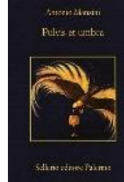
Pulvis et umbra di Antonio Manzini (Sellerio)