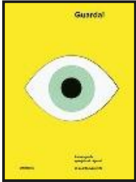
Guarda! di Joel Meyerowitz (Contrasto)