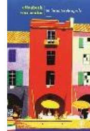
Un incantevole aprile di Elizabeth von Arnim (Fazi)