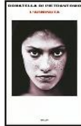
L'arminuta di Donatella di Pietrantonio (Einaudi)

letto da Samantha Pascotto 25 racconti brevi, 25 ritratti di nottambuli: c'è la neomamma single che ha appena scoperto le gioie della maternità e dell'allattamento quando la città dorme; c'è il panettiere in pensione abituato a vivere la notte; c'è la studentessa universitaria al buio e al silenzio dedica la sua vera passione: la lettura. Il fil rouge che unisce le storie è una donna senza nome che vaga per le vie di Monaco, suonando i campanelli delle case in cui intravede persone sveglie e raccogliendo le loro storie. Queste. Lo regalo a... l'amica nottambula che sa quanto la notte può essere un dono.