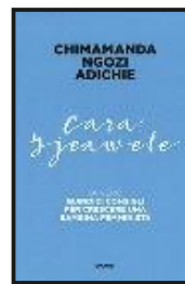
Cara Ijeawele di Chimamanda Ngozi Adichie (Einaudi)