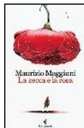
La zecca e la rosa di Maurizio Maggiani (Feltrinelli)