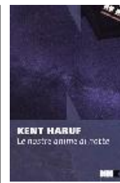
Le nostre anime di notte di Kent Haruf