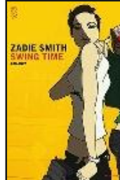
Swing Time di Zadie Smith (Mondadori)