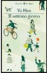
Il settimo giorno di Yu Hua (Feltrinelli)