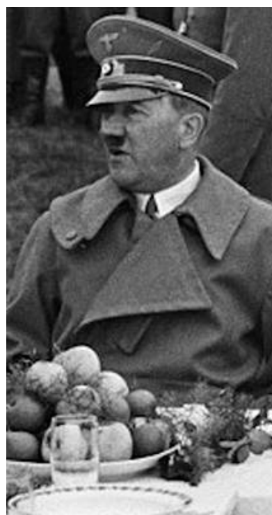
Rosella Postorino, 'Le assaggiatrici' Feltrinelli, 286 pagine, 17 euro

cino alla Wolfsschanze, il quartier generale del Führer, nascosto nella foresta, e che su indicazione del sindaco nazista verrà reclutata dalle SS come assaggiatrice. Ma tutto questo si capirà un po' alla volta. La Postorino ci fa entrare subito nella pelle della protagonista davanti al suo piatto nello stesso tempo salvifico, per la fame pregressa, ma potenzialmente letale. «Al centro, un lungo tavolo di legno su cui avevano apparecchiato per noi», racconta nella prima pagina del libro. Ed è intorno a questa tavola che si gioca il destino di dieci donne fra le quali ci sono quelle che vengono chiamate le «esaltate», felici di mettere a rischio la loro vita per Hitler, e quelle, come Rosa, che non vorrebbero più tornare davanti a quella tavola. Nella mensa forzata, nascono amicizie e rivalità sotterranee fra queste donne che considerano Rosa la straniera e arrivano anche regali dal cuoco Briciola. Quando le SS ordinano di mangiare è la fame ad avere la meglio, ma poi sale l'angoscia e la paura di morire. Le assaggiatrici devono restare un'ora sotto osservazione per garantire che il cibo del Führer non sia avvelenato. Rosa è una donna in trappola, nei