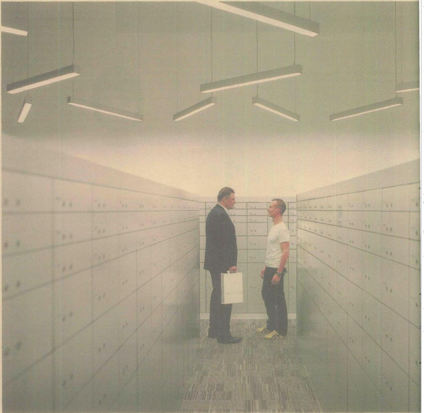
La proprietà intellettuale è riconducibile alla fonte specificata in testa alla pagina. Il ritaglio stampa è da intendersi per uso privato