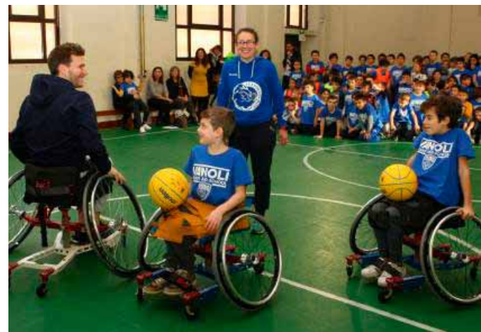
Travis Diener prova il basket in carrozzina alla Trento e Trieste

tendo la pratica costante di attività sportive ed il raggiungimento degli obiettivi del progetto e a programmare corsi di formazione. Il capofila del progetto è il liceo Anguissola, mentre la prima scuola che ha iniziato la sperimentazione è il plesso Trento e Trieste dell'Istituto Comprensivo di Cremona 1, con la classe quarta A che,