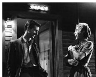
"Psycho" (1960) Anthony Hopkins-Norman Bates portiere psicopatico