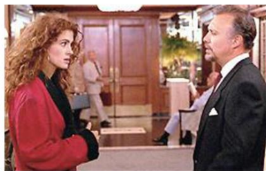
"Pretty Woman" (1990) Nel film di Garry Marshall, il direttore d'hotel è l'angelo custode di Julia