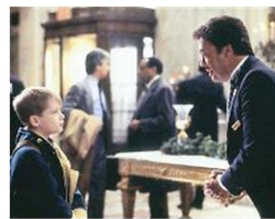
"Mamma ho riperso l'aereo" (1992) Macaulay Culkin dà filo da torcere al portiere Tim Curry