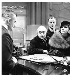
"Grand Hotel" (1932) «Gente che va, gente che viene». Con Garbo