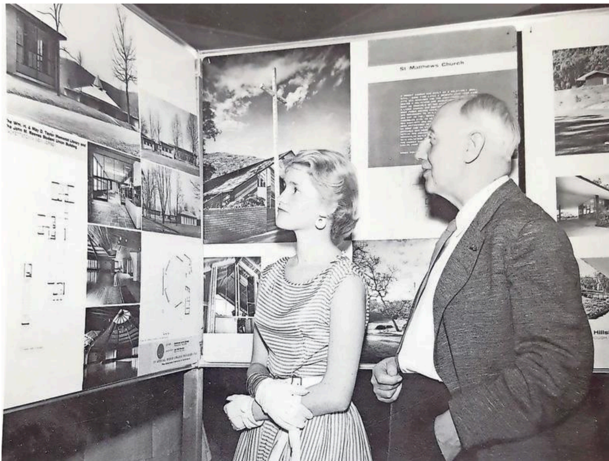
Dudok met een Amerikaanse studente, 1953.

Een enkele keer ging het mis. In New Orleans, waar Dudok 's morgens om acht uur aankwam, was er niemand om hem van het station te halen. Daar sta je dan met je bagage! Ik woedend', schreef de architect hierover aan zijn vrouw. Nadat hij een taxi naar de univers-