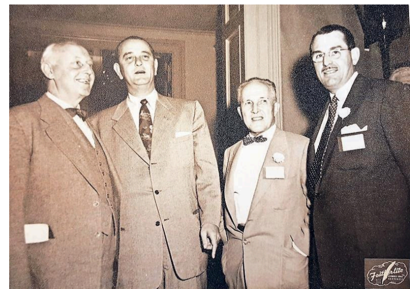
Dudok bij de uitreiking van de AIA Gold Medal in 1955.

Velen namen ook de moeite om Dudoks architectuur met eigen ogen te komen aanschouwen. Dudok was altijd bereid om bezoekers persoonlijk rond te leiden door Hilversum of zijn raadhuis, waarbij hij graag uitweidde over zijn stedenbouwkundige ideeën of over de architectonische principes in zijn ontwerpen. Een Amerikaanse