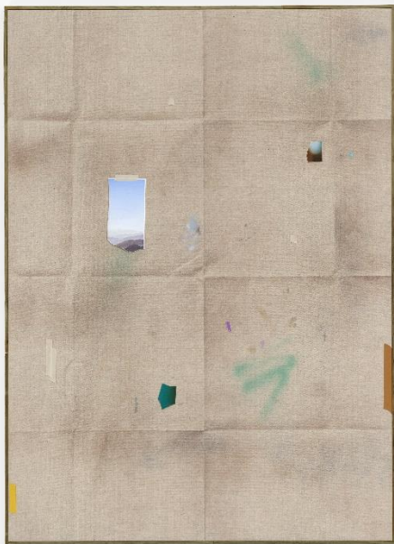
Untitled (C.D. Friedrich IV), 2022, oil, acrylic and spraypaint on canvas, wooden frame, 162 x 117 cm