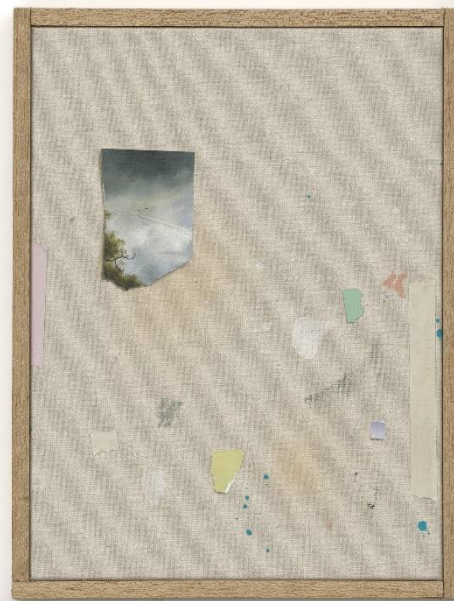
Untitled (Van Ruisdael II), 2021, oil, acrylic and spraypaint on canvas, wooden frame, 43 x 32,5 cm

Accidenteel ontstane vlekken, verfspatten en (voet)sporen op een stuk ongeprepareerd linnen op de grond, vormen de basis voor het werk van Ritsart Gobyn. Het toeval wordt toegelaten, pas daarna start het zoeken naar een doelgerichte compositie. Het gevoel van onafgewerkt blijft evenwel een belangrijk ingrediënt. Stukjes tape, kleurrijke willekeurig gescheurde en geknipte papiersnippers of post-its verschijnen op het doek. Herkenbare, pure gebruiksobjecten met als doel om achteraf te verwijderen, maar door de monochrome