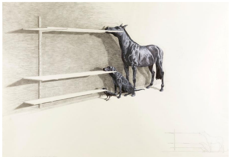
The dressage nr II , 2017, studie voor film, kleurpotlood en aquarel op geprepareerd papier, 77 x 57,5 cm