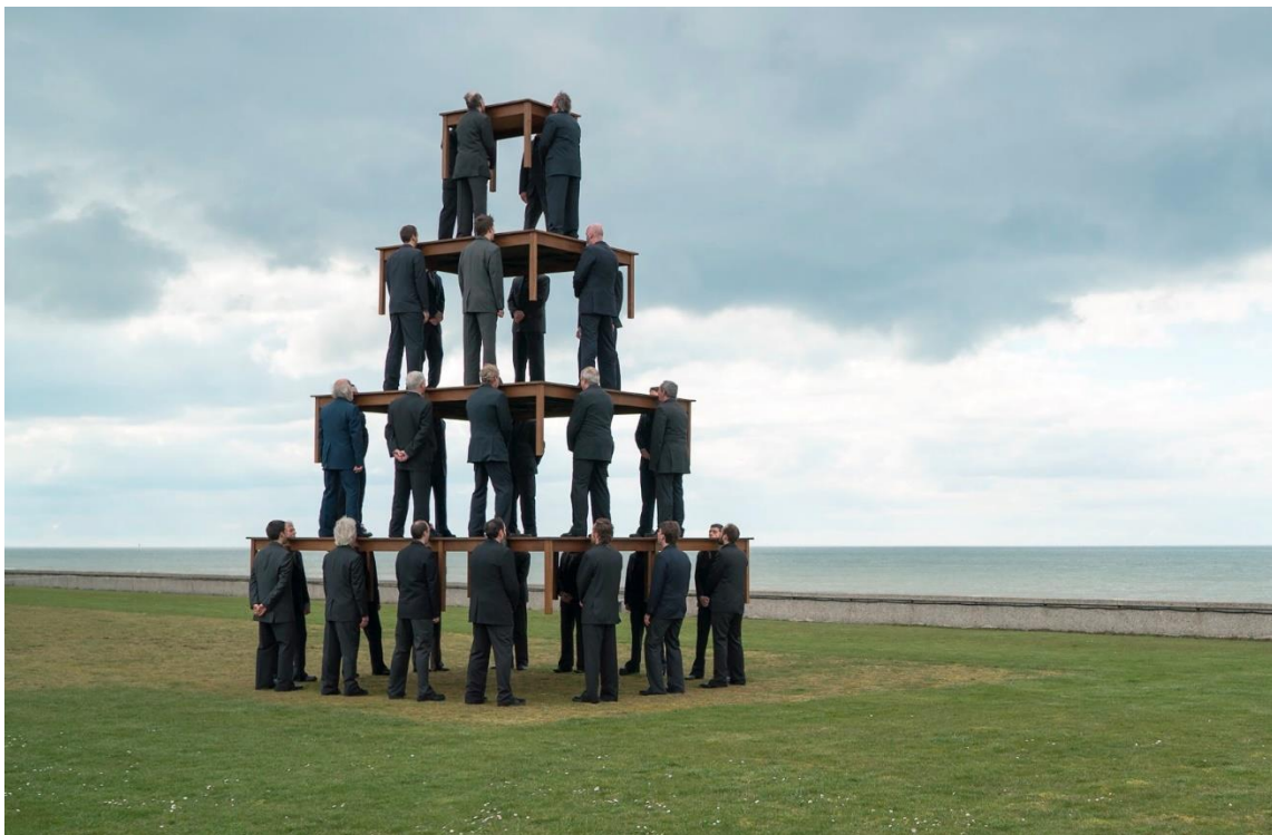
Stasis, 2018, live performance tentoonstelling 'The Raft. Art is (not) Lonely', Muzee, Oostende.