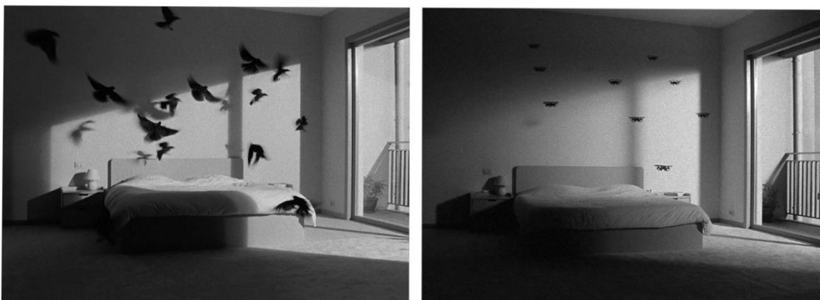
Black Sun , 2022, 16mm zwart-witfilm overgebracht naar HD, stereofonisch geluid (2 kanalen), 11 min, Courtesy the artist en Geukens & De Vil