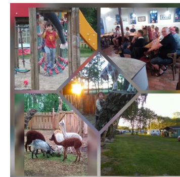
Velkommen til Aarø Camping

Betalingsmiddel på festivalen er Aarø campings betalingskort, gamle kort fra sidste år kan/skal opdateres i receptionen for at kunne anvendes.