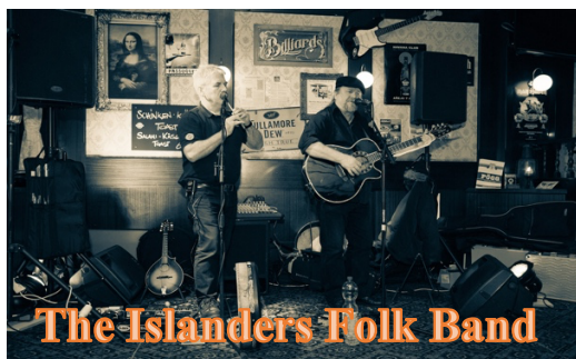
The Islanders Folk Band