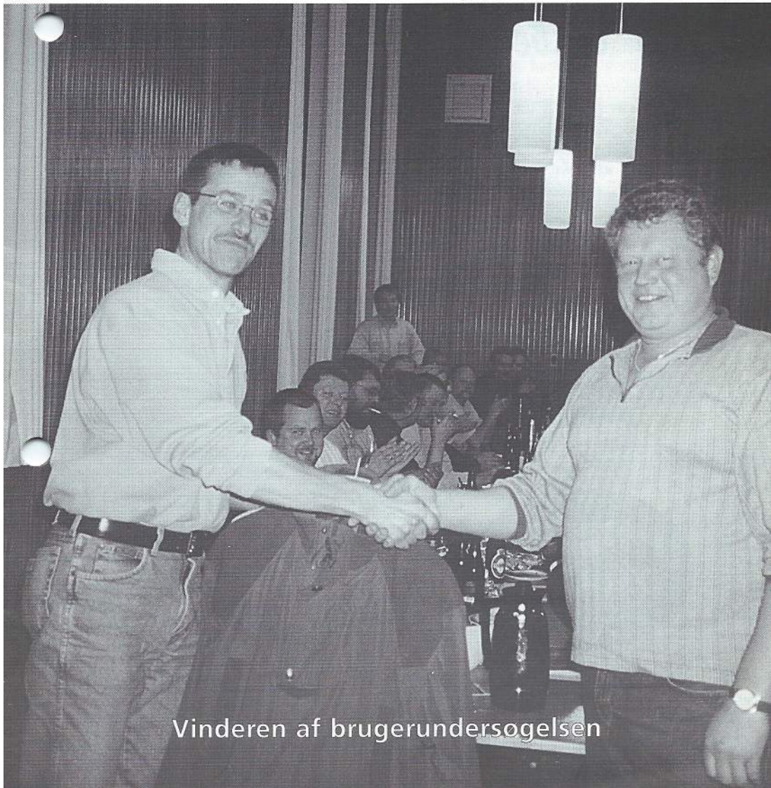
Vinderen af brugerundersøgelsen