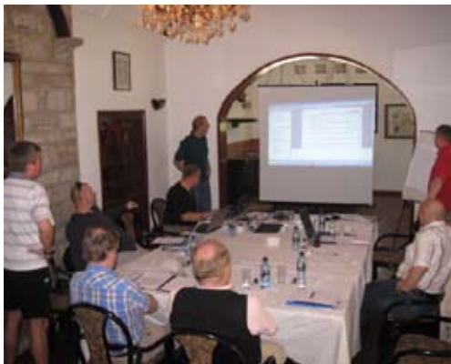
NORDEFECO delegationen gennemfører den afsluttende koordination og forberedelse til Workshoppen.