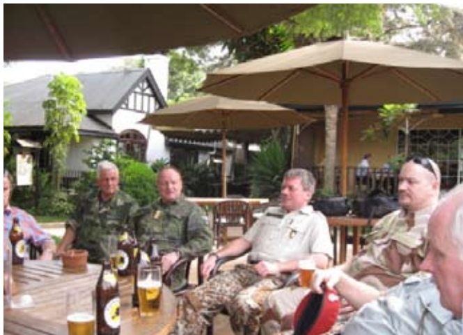
Tilbage på Karen Blixen Coffee Garden blev dagens resultater debatteret ihærdigt blandt den delegationens medlemmer.

ønske om at kunne facilitere det første CIMIC kursus allerede i NOV/DEC 2011.