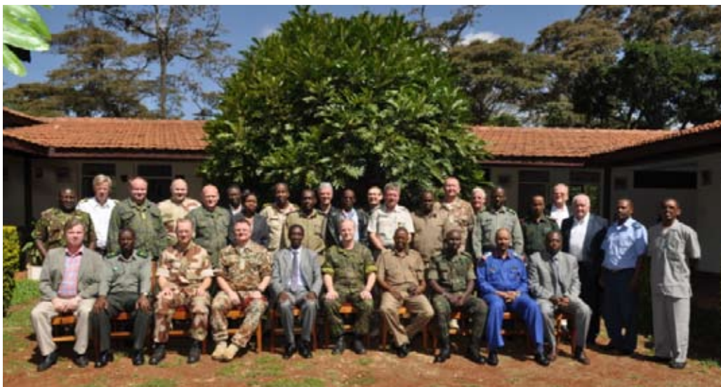
NORDEFECO delegationen sammen med repræsentanter fra EASF.

ket blev nøje gennemgået og drøftet ihærdigt under workshoppen i Nairobi. Økonomi spiller også i Afrika en stor rolle og emnet gav anledning til en til tider ophedet debat primært EASF repræsentanterne imellem. Specielt standarder for indkvartering af kursister gav anledning til langvarige drøftelser, idet disse kan variere i nogen grad og dermed den økonomiske byrde