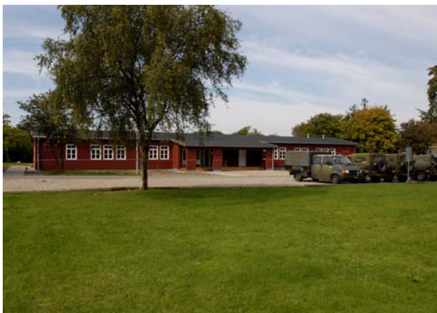
Bygning 25 - KRONBORG

KRONBORG er i foråret 2009 blevet totalreleveret og anvendes til undervisning, kontorer, depot o.s.v.