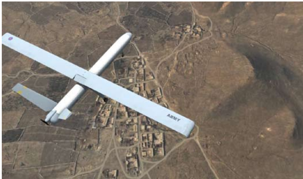
Britisk Hermes 450 "Green Eyes" flyver over den virtuelle kampplads.

stor realisme over de forskellige ammunitions-typer, ligesom effekten i målet i høj grad afspejler virkeligheden. Det eneste man mangler er trykbølgen, når der skydes nært mål.