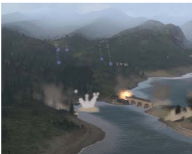
Ilden i målet med 155 mm

Derudover kan der spilles mange andre personer ind, eksempelvis; legende børn, tv hold (kameramand og reporter), lokale politistyrker, civile der demonstrerer mod taliban/egne styrker, gedehyrder, VIP statsoverhoveder mm. Den hvide Toyota Corolla (terroristens foretrukne) og Jingle Trucks (lastbiler kendt fra Afghanistan/Pakistan) har heller ikke har undgået programmørernes blik. Programmet indeholder et væld af flyvende platforme fra bemandede fly og helikoptere til ubemandede fly (både mini UAV og taktiske UAV, bevæb-