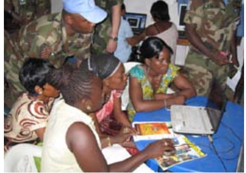
Den nordiske delegation besøger et CIMIC projekt, hvor kvinder modtager IT undervisning.

man i praksis udfører CIMIC projekter i tråd med de anførte begreber drøftet under samtalen med SRSG/UNMIL.