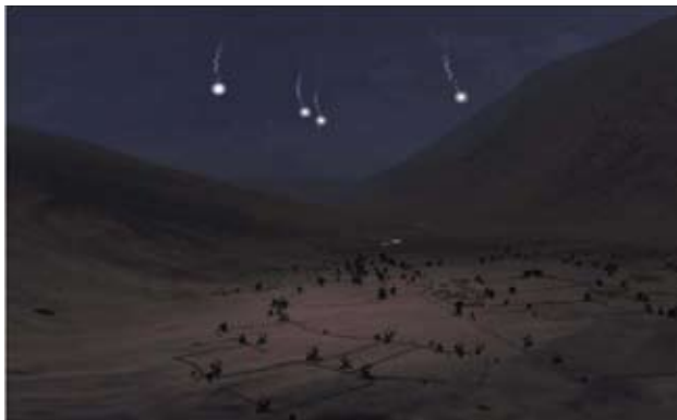
Lysskydning – "Ruder"

VBS 2 kan anvendes til at gennemføre klasseundervisning som vi kender det fra ARTSIM,