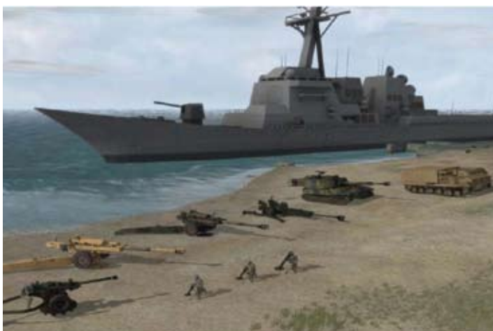
Ildstøttemidler der pt. er inkluderet i VBS 2 Fires.

Såfremt VBS 2 integreres i en Joint Fires simulationskapacitet vil artilleriet blive absolut