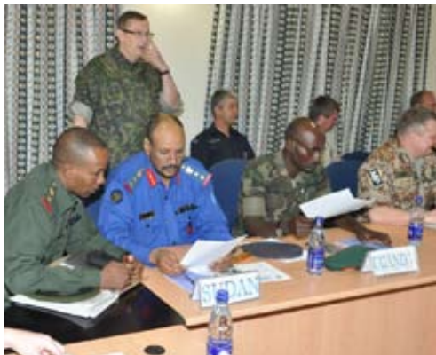
Repræsentanterne fra de deltagende nationer drøfter oplæg m.m.

sisterne blive indstillet via medlemslandene og udvalgt ved PLANELM/EASF foranstaltning. CoE værtsnationen kan få op til 50 % af kursuspladserne og de resterende pladser tilbydes de øvrige medlemslande af EASF.