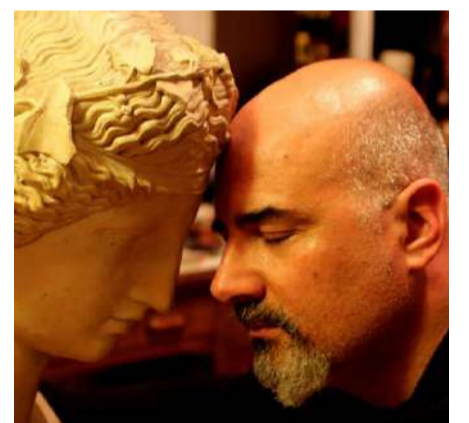
Rubrica a cura del dott. Alessandro Spampinato Psicologo e cantautore

è assenza di desiderio, l'opposto dell'odio è vulnerabilità totale, l'assenza di ignoranza è la sapienza. Queste due dimensioni segnano in negativo la vita e muovono verso la patologia. La verità, come sempre è nel mezzo, nel desiderio e nelle emozioni che ci portano vitalità e nella conoscenza di sé e del modo, nell'esperienza conoscitiva che ci fa evolvere in consapevolezza e verità. Anche se la cultura dominante ci spinge verso l'eccesso, l'estremo, il top di tutto è nostro compito di esseri umani consapevoli aspirare all'equilibrio e alla giusta distanza dagli opposti.