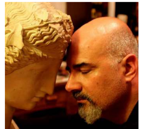
Rubrica a cura del dott. Alessandro Spampinato Psicologo e cantautore

propri, puerili o addirittura sbagliati. Basti pensare, ad esempio, a quelle persone che dicono di "amare" la propria compagna e proprio per questo la ossessionano con la loro gelosia, la controllano e la limitano "per proteggerla" fino a farle del male per "farla ragionare". L'amore, invece, è una espressione della consapevolezza e della maturità che proviene dall'esperienza ma soprattutto è amore quando siamo disposti a rinunciare a noi stessi e ai nostri egoistici bisogni in favore del bene dell'altro.