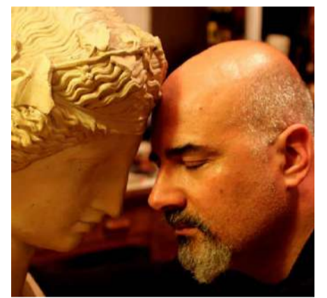
Rubrica a cura del dott. Alessandro Spampinato Psicologo e cantautore

Visita il sito www.alessandrospampinato.com