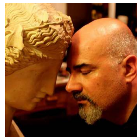
Rubrica a cura del dott. Alessandro Spampinato Psicologo e cantautore

Visita il sito www.alessandrospampinato.com