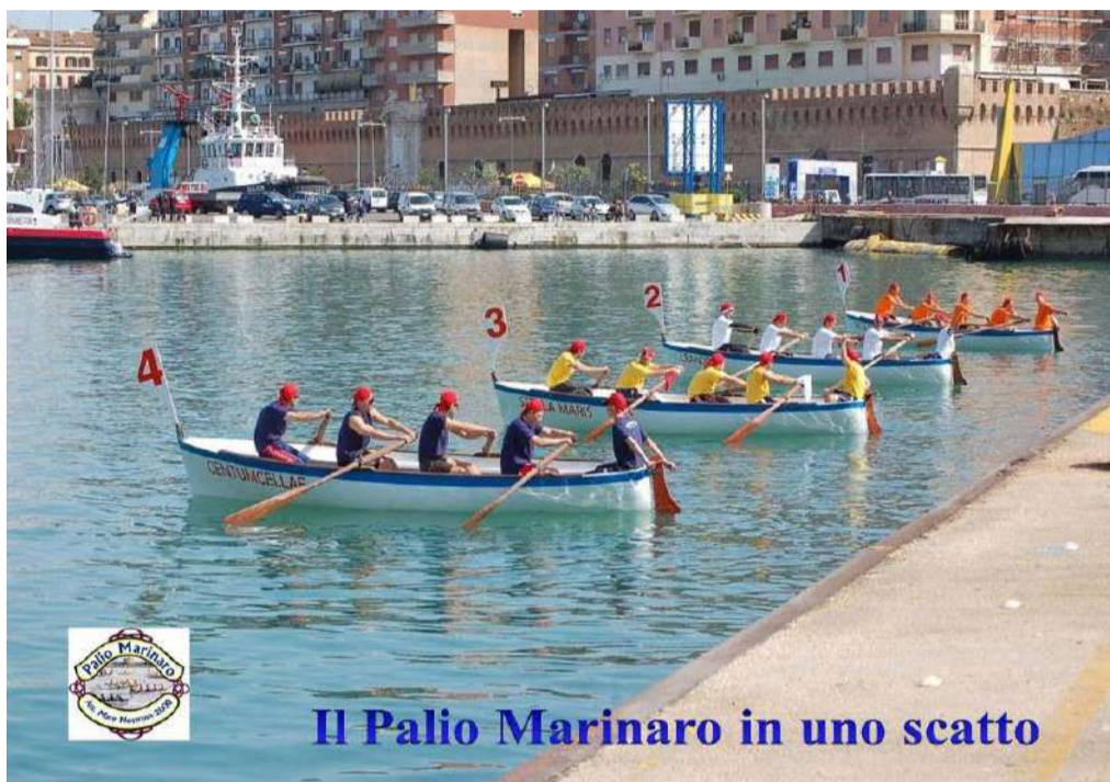
Il Palio Marinaro in uno scatto