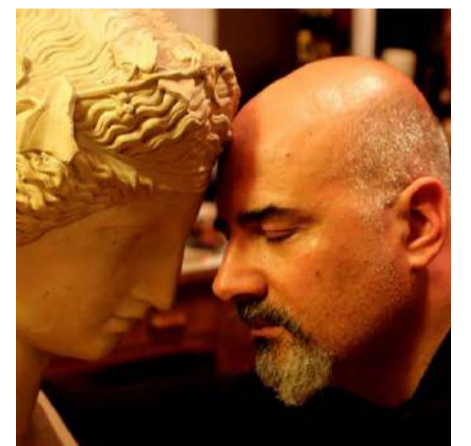
Rubrica a cura del dott. Alessandro Spampinato Psicologo e cantautore

stra coscienza alla luce del sole e all'aria candida, innocente e bella. Infine la rosa. È questo un fiore rosso come il sangue, il suo bocciolo è a forma di cuore e ha le spine che pungono e fanno male a sua difesa. La rosa rappresenta il cuore, centro della nostra vita, fragile, delicato, che va difeso per non essere offeso e non morire. La natura dell'amore è questa. L'amore si dona e si consuma da sé e per sé, a prescindere da tutto! Vince gli elementi grezzi e le avversità per rivelarsi nella sua bellezza e purezza rigenerandoci, va difeso perché fragile, abita nel cuore e anima il sangue che ci scorre nelle vene. E', dunque, l'essenza della nostra vita.