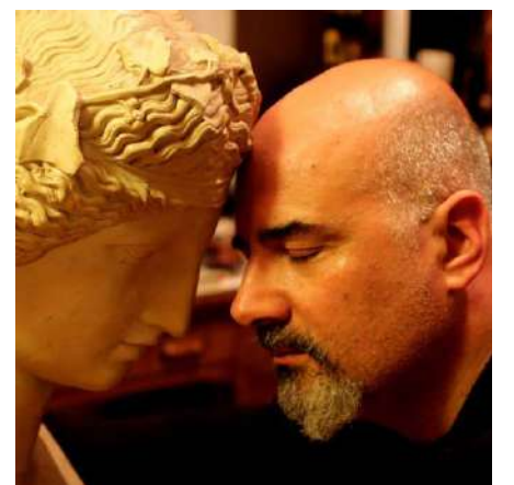
Rubrica a cura del dott. Alessandro Spampinato Psicologo e cantautore

In oriente non stanno messi meglio di noi, il loro sistema religioso, politico ed economico, per certi versi, è ancora più schizofrenico del nostro.