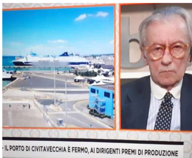
IL PORTO DI CIVITAVECCHIA È FERMO, AI DIRIGENTI PREMI DI PRODUZIONE

Vetrina in una trasmissione di grido anzi... di coro per Civitavecchia, che però ne avrebbe fatto volentieri a meno. Fuori dal Coro, la produzione Mediaset affidata alle cure di Mario Giordano, si è infatti interessata in settimana dei tanto discussi premi di produttività (anzi, di performance) che si sono spartiti vertici e dirigenti dell'Autorità di sistema portuale. Mezzo milione di euro che ha fatto rumore, soprattutto in un porto dove lo spettro della disoccupazione aleggia sul settore della sicurezza (Pas), del