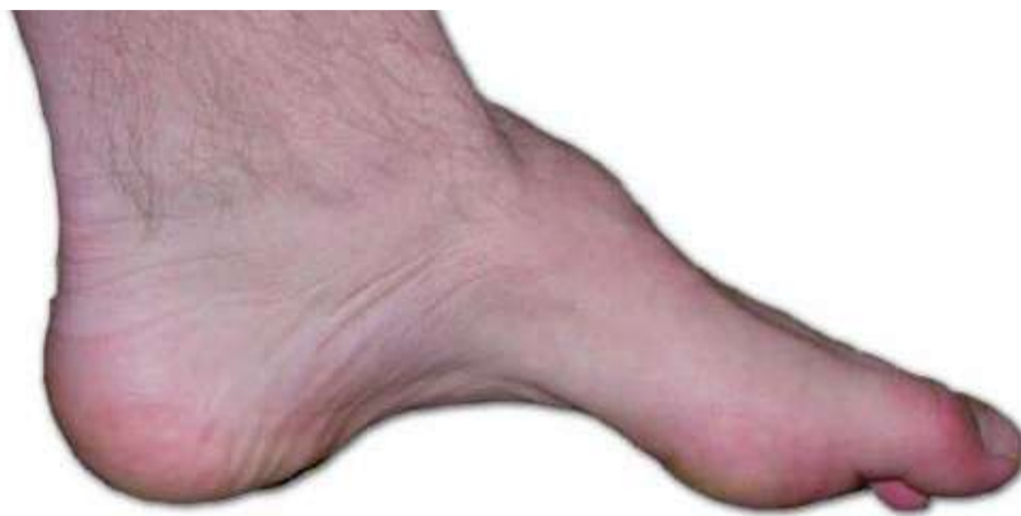
Piede cavo neurologico

·Cavo-varo (caratterizzato da una spiccata supinazione del retro piede, questo comporta