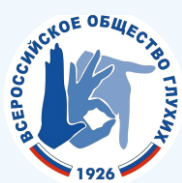
Адыгейская Республиканская общественная организация «Всероссийское общество глухих»