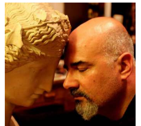
Rubrica a cura del dott. Alessandro Spampinato Psicologo e cantautore

stessi criteri e bisogni, mentre l'essere che noi siamo si rispecchia nel e si riconosce nell'universo e nel suo mistero che è il tutto di cui fa parte. Ma questa presa di coscienza e questo riconoscimento appartengono al bambino che si cela nell'adulto, perché solo un bambino ha uno sguardo puro, innocente, semplice e curioso. L'adulto, invece, pensa di sapere già tutto e quindi non vede e non sente se non ciò che conferma il suo misero e polveroso punto di vista.