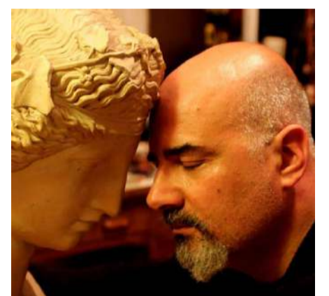
Rubrica a cura del dott. Alessandro Spampinato Psicologo e cantautore

neanche parlano, solamente sussurrano. E quando l'amore è più intenso, non è necessario nemmeno sussurrare, basta guardarsi. I loro cuori si intendono. E' questo che accade quando due persone che si amano si avvicinano". Infine il pensatore concluse dicendo: "Quando voi discuterete, non lasciate che i vostri cuori si allontanino, non dite parole che li possano distanziare di più, perché arriverà il giorno in cui la distanza sarà così tanta che potrebbero non incontrare più la strada per tornare".