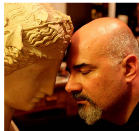
Rubrica a cura del dott. Alessandro Spampinato Psicologo e cantautore

solitudine, quando è una scelta consapevole, diventa un laboratorio interiore in cui si trasformano le cose, le si lavorano e le si fanno proprie. L'isolamento, invece, è una condizione subita e innaturale da cui non viene fuori nulla di buono e di utile. Nell'isolamento la persona soffre, si deprime e si arrabbia e per questa ragione viene usato come strumento di punizione