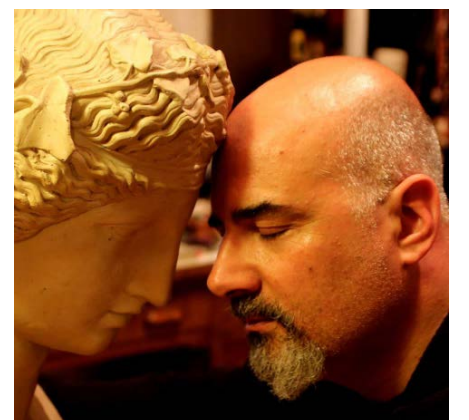
Rubrica a cura del dott. Alessandro Spampinato Psicologo e cantautore

nato. Ecco la radice delle nuove paure umane. La solitudine reale e il conseguente rifugio nella realtà virtuale.