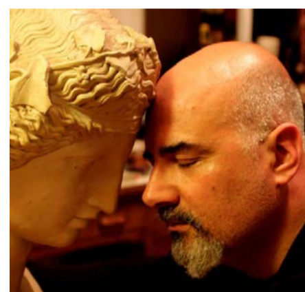
Rubrica a cura del dott. Alessandro Spampinato Psicologo e cantautore

Impariamo il metodo di imparare le cose della vita e chi siamo, impariamo a ragionare e a dialogare e insegnamolo ai giovani.