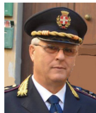
Rubrica a cura del Dott. Remo Fontana Dott. in Scienze per l'Investigazione e la Sicurezza Criminologica Vice Comandante della Polizia Locale di Civitavecchia