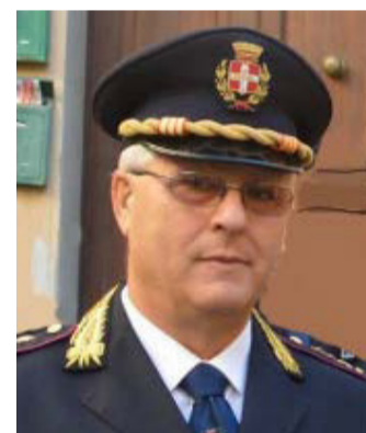
Rubrica a cura del Dott. Remo Fontana Dott. in Scienze per l'Investigazione e la Sicurezza Criminologica Vice Comandante della Polizia Locale di Civitavecchia